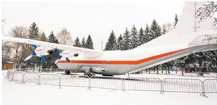
Любимое место отдыха преобразится.

Администрация города Кемерово объявила аукцион на поиск подрядчика, который выполнит первый этап благоустройства парка «Антошка». Работы завершатся уже в октябре текущего года.