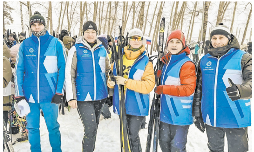
Любители активного образа жизни успешно выступили на соревнованиях.