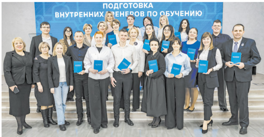
Первые тренеры скоро приступят к работе.

Комбинат «КМАруда» планомерно увеличивает производственные показатели в рамках масштабного проекта по увеличению мощностей предприятия до семи миллионов тонн руды в год. В 2025 году это позволило ПМХ выйти на полную самообеспеченность железорудным сырьём.