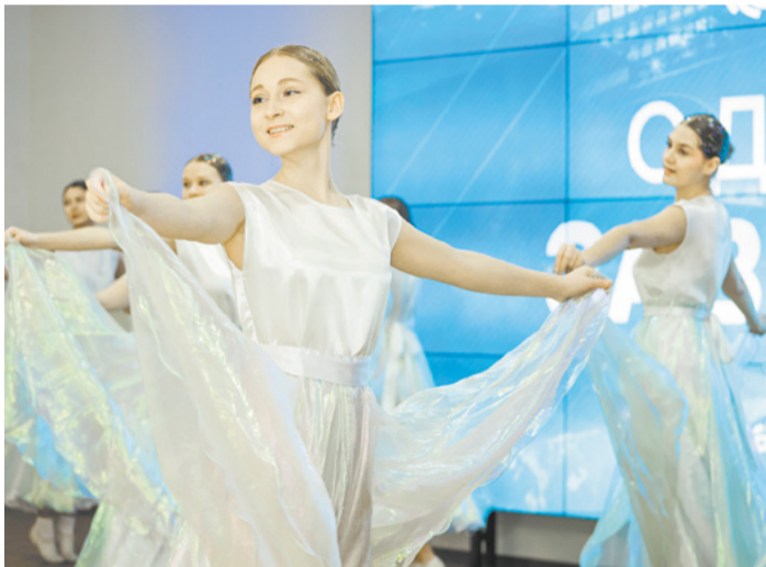
Детские коллективы порадовали творческими номерами.