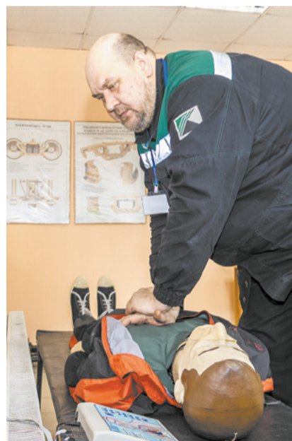
Второй этап – оказание первой медицинской помощи.