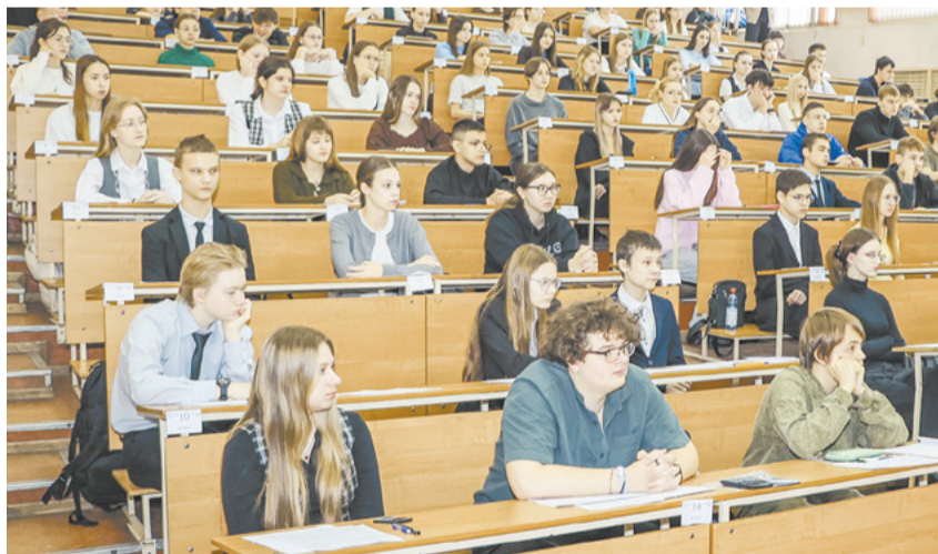
Школьники продемонстрировали знания в области коксохимии.

сегодня продемонстрируете. Пусть ваши ожидания не подведут вас. Независимо от результатов испытания помните: сегодня химия приобретает ведущую роль в развитии промышленности, а значит квалифицированные кадры и в будущем будут востребованы в этой сфере.