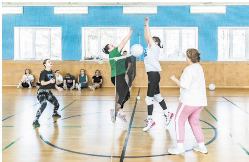
Команда ПКО стала лидером в миниволее.

сразились спортсменки из коксового цеха, ПКО и ОТК. Во второй сошлись «Полный абзац», «Позитив» и «Леди Кокса».