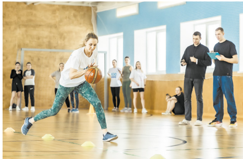
«Полный абзац» взял золото в смешанной эстафете.

Традиционная женская спартакиада к 8 Марта прошла в ПАО «Кокс». Любовь к спорту и желание завоевать лавры победителей объединили семь команд. Самые обаятельные и привлекательные сражались в шести видах: бадминтоне, миниволе, дартсе, прыжках в длину, смешанной эстафете и настольном теннисе.