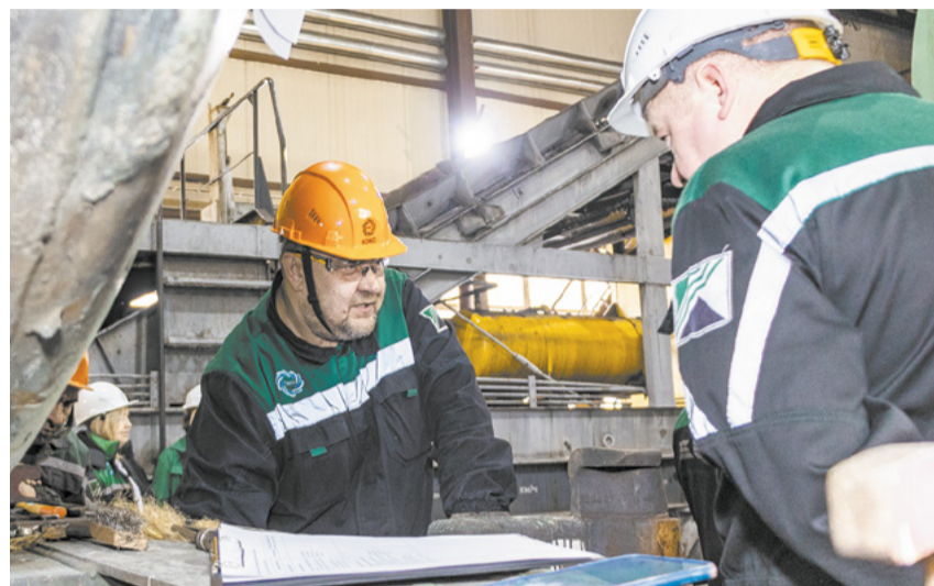
На практическом этапе заменили концевой кран и выполнили ремонт сцепки.

– В нашей работе резину тянуть не следует, но и сильно торопиться не стоит. Спешка чревата ошибками и нарушениями техники безопасности. Нам посовето-