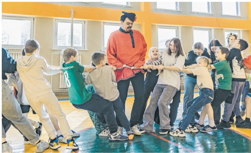
Весёлый праздник устроили коксохимики для ребятшек из детского дома.

Екатерина ЛЕВОНТЬЕВА levonteva_ep@metholding.com