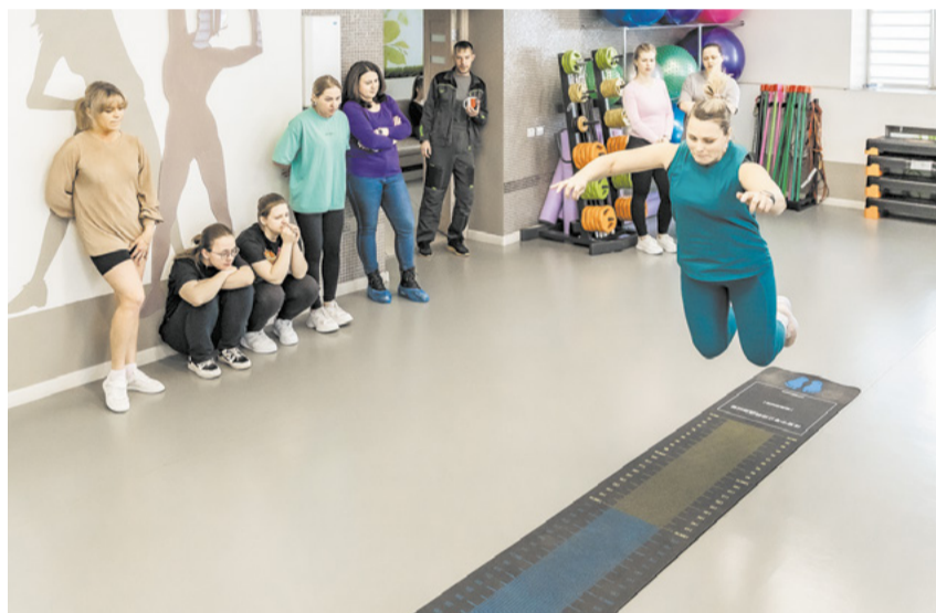
Заслуженное серебро в прыжках у коксового цеха.