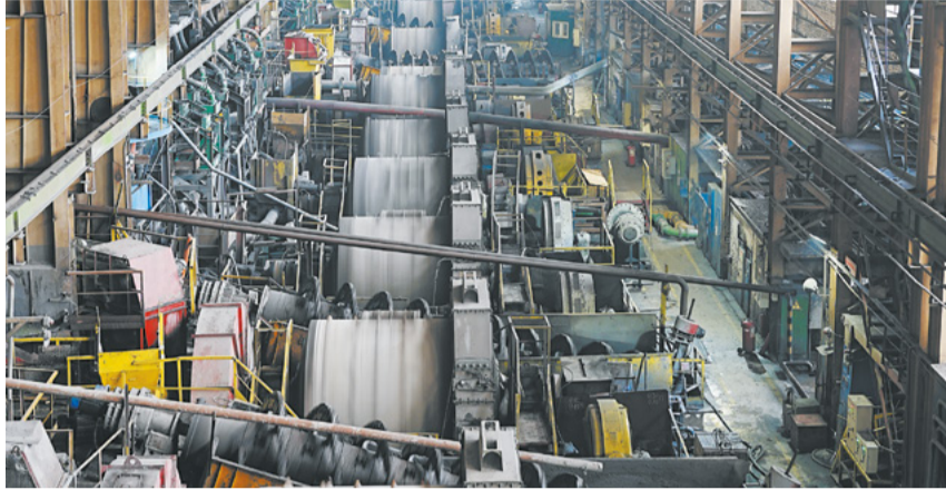
«КМАруда» увеличила производственные показатели.

ПМХ установил месячный рекорд по объёмам производства железорудного концентрата.