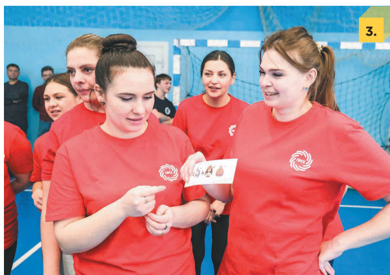
3. В состязании «Дамская сумочка» участницы проявили свою смекалку.