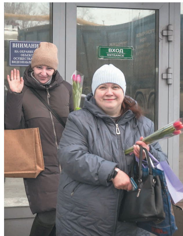
↑ На Тулачермете цветы вручали на проходных предприятия.