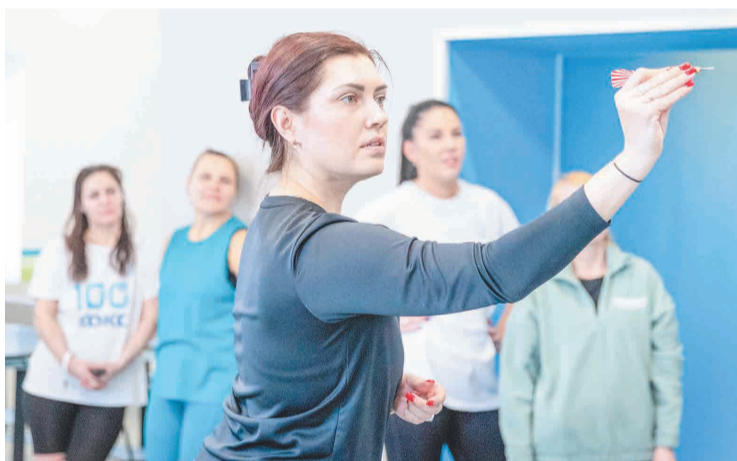
↑ В соревновании участвовали семь команд.