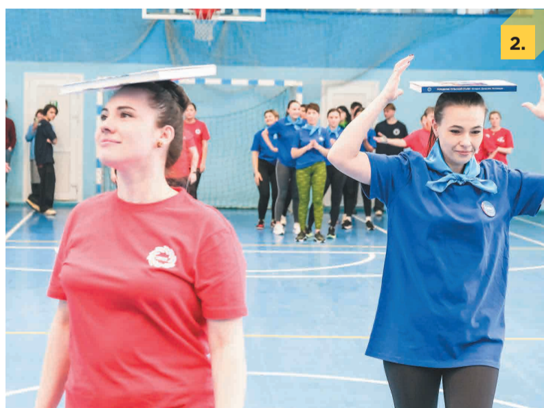
2. Эстафета с книгами — настоящее соревнование на координацию.