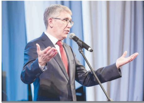
Дмитрий Мильев Губернатор Тульской области.

В Тульской областной филармонии состоялось торжественное мероприятие, посвященное Международному женскому дню.