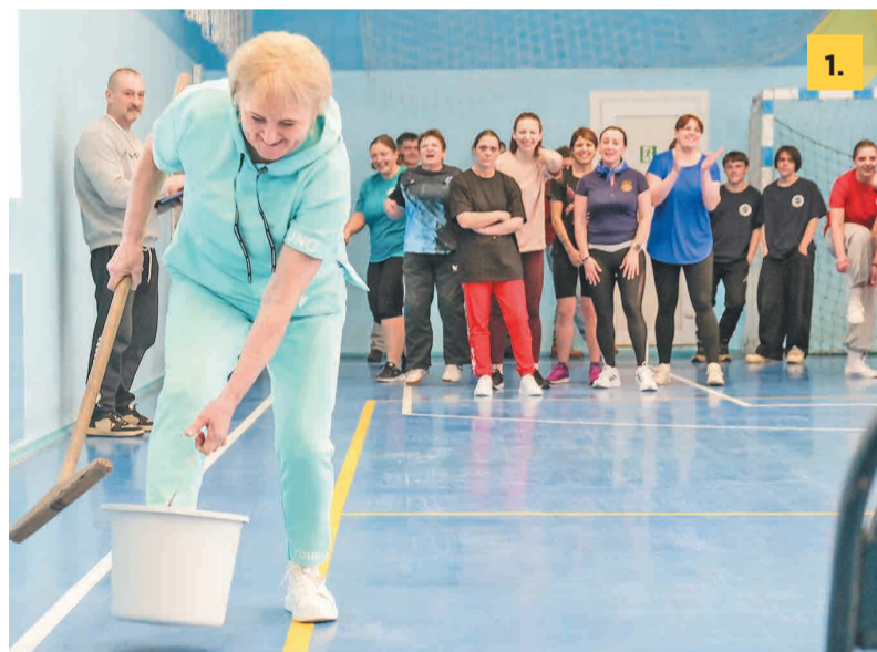
← 1. В конкурсе «Баба Яга» девушки соревновались в скорости реакции.