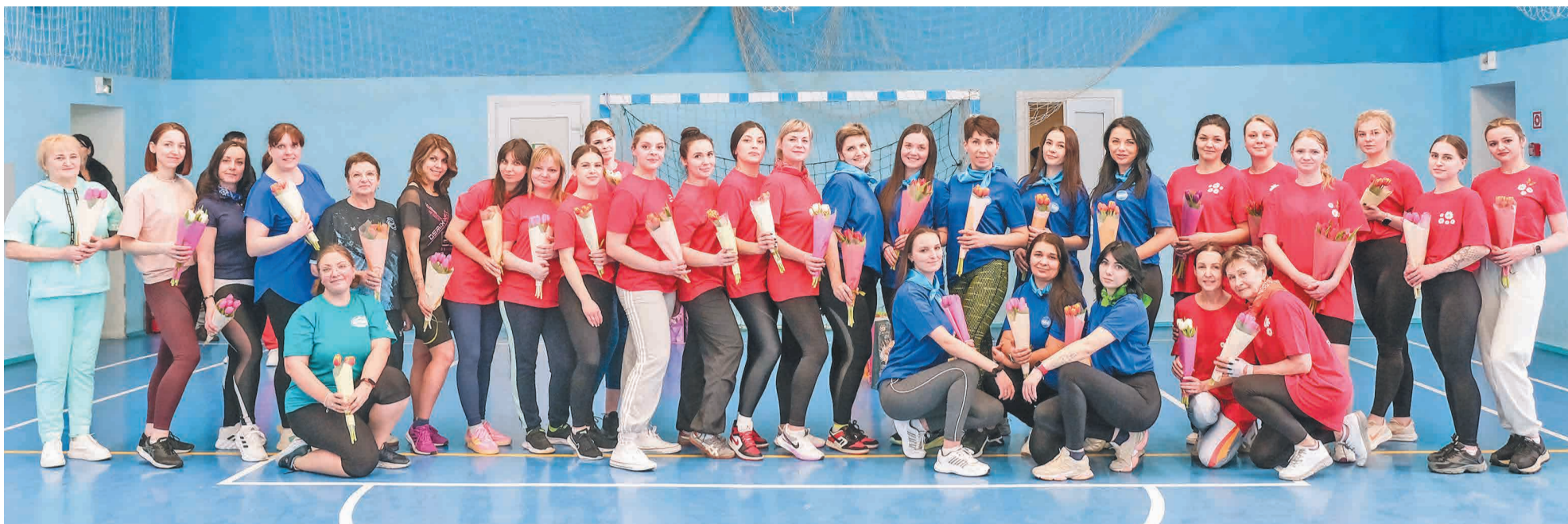
↑ Все участницы соревнований.