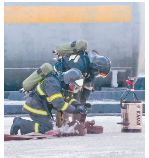
↑ Учения позволяют отработать навыки реагирования.

После передачи информации о разливе оперативным дежурным службам завода на место аварии прибыла АГСС. В считанные минуты дежурной сменой газоспасателей с пожарного автомобиля была подана пена на зеркало разлитого нефтепродукта для предупреждения возгорания. Слой пены толщиной не менее пяти сантиме-