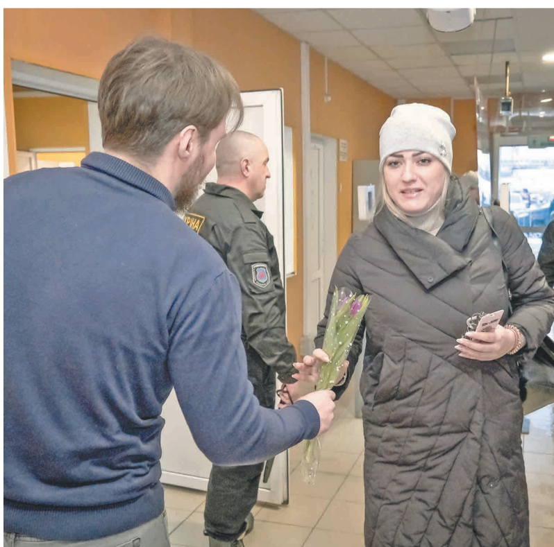
↑ 450 сотрудниц Промсорт-Тулы получили хорошее настроение.