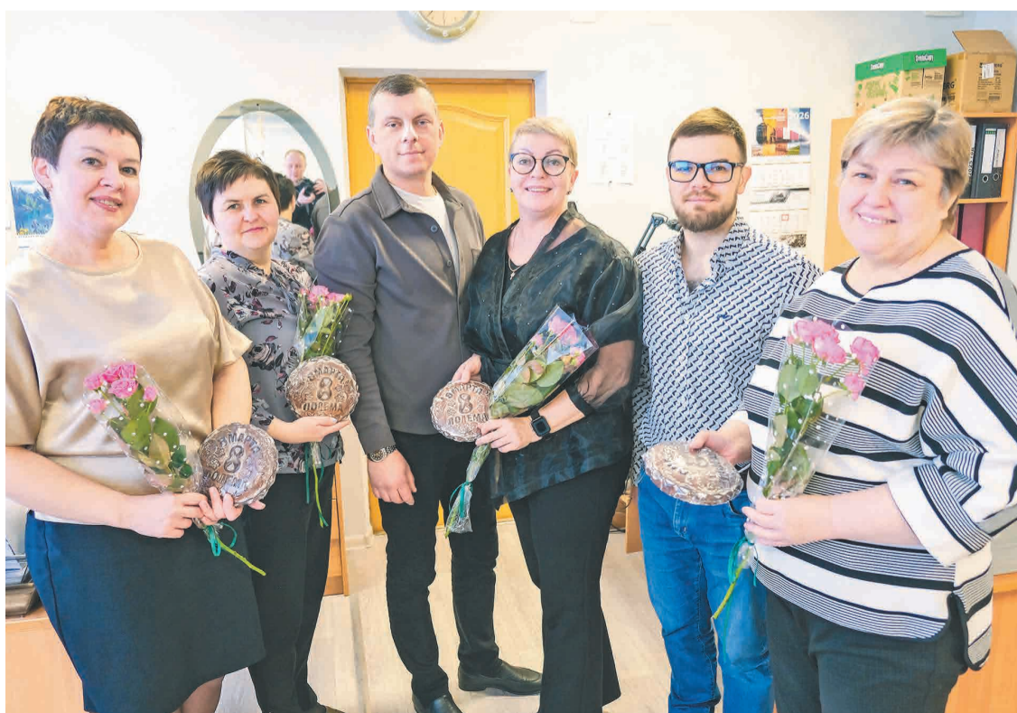
↑ На заводе «ПОЛЕМА» символом дня стали благородные розы.