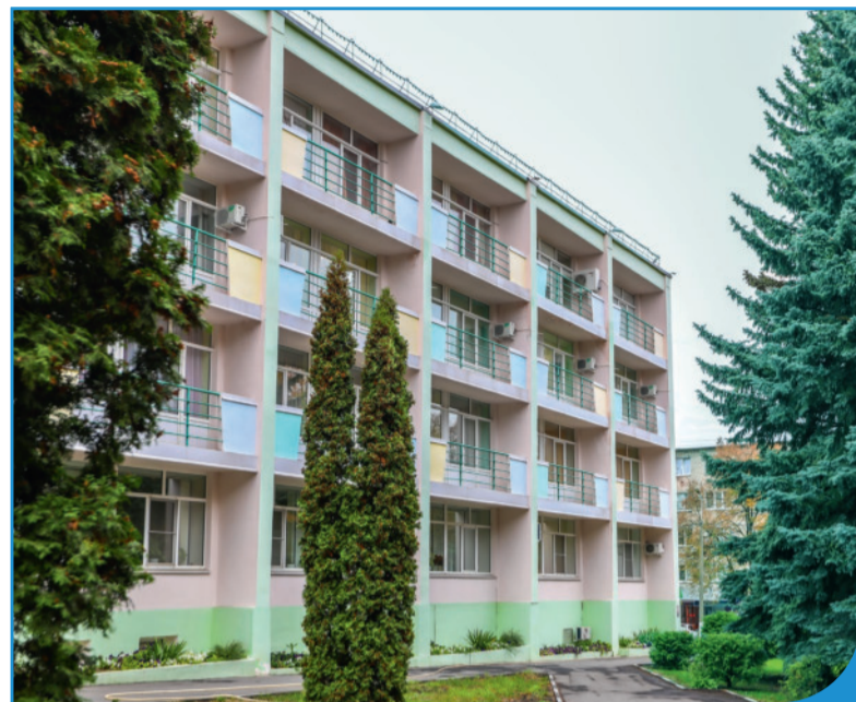
Санаторий-профилакторий МСЧ комбината КМАруда.