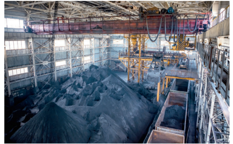
Цель 2026 года – наращивать производственный объем.

Железнодорожный цех комбината установил суточный максимум по отгрузке концентрата для Тулачермет. Основному грузополучателю отправлено 12,7 тысяч тонн готовой продукции.