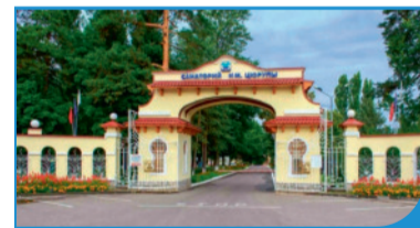
Санаторий им. Цюрупы (г. Воронеж)