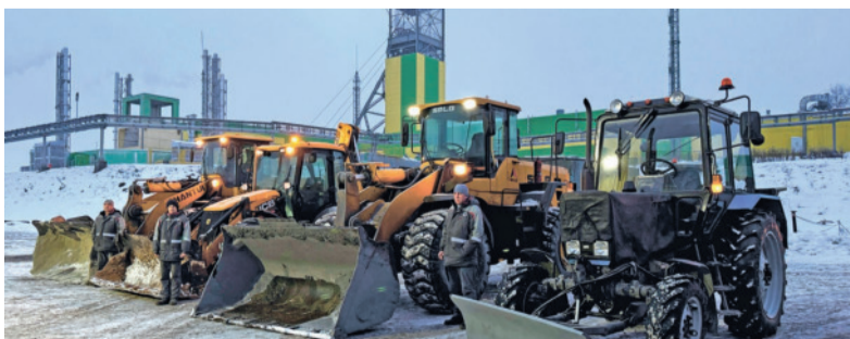
Самоходная техника автоцеха прошла техосмотр.

Успех подтверждает ответственное отношение работников автоцеха к своим обязанностям.