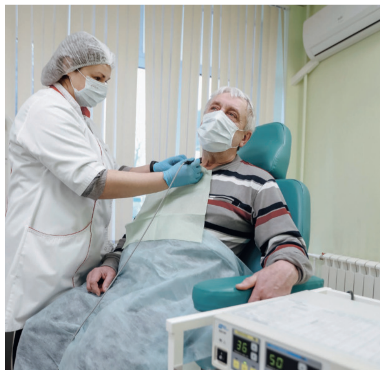
Процедура электрокоагуляции проводится на месте.

гие доброкачественные новообразования удалим на месте высокочастотным электрохирургическим коагулятором. Процедуру можно делать круглый год, чего не скажешь криомассаже. Убирают пигментацию и выравнивают цвет лица жидким азотом только в сезон с низкой солнечной активностью. К слову, услуга есть в медсанчасти комбината.