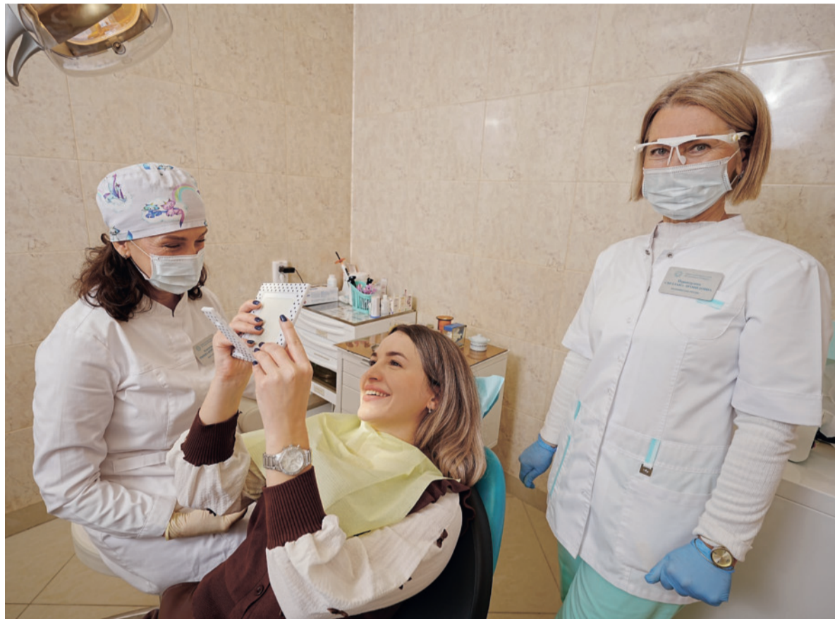
Улыбайся, если хочешь быть здоров!

Весной мы особенно внимательны к своей внешности. Врачи медико-санитарной части комбината КМАруда рекомендуют эффективные оздоровительные процедуры для красивой улыбки и здоровой кожи.