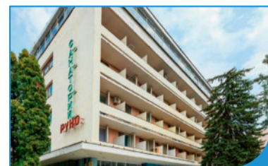
«Руно» (г. Пятигорск)