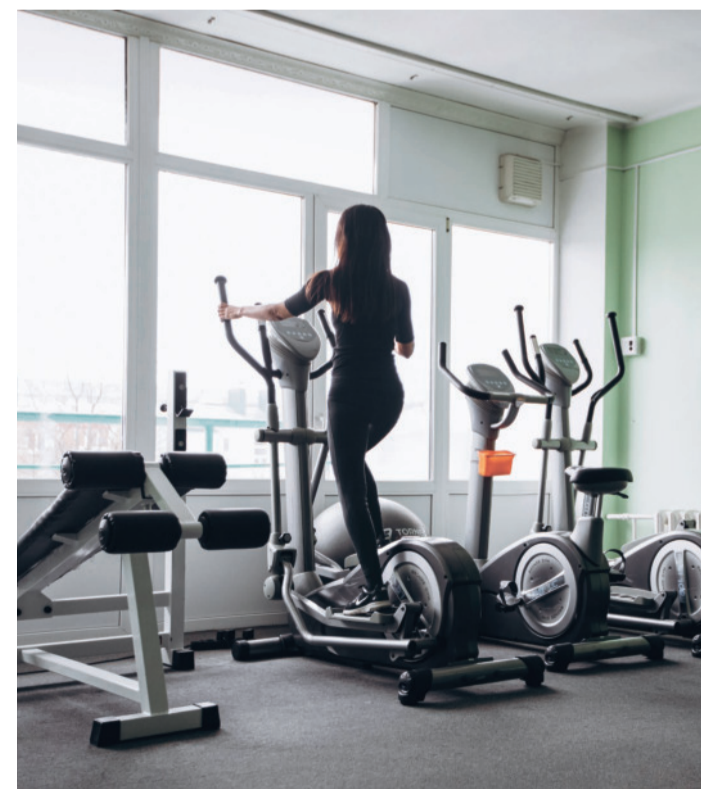
Около двух десятков тренажеров на все группы мышц – для спортсменов комбината.

22 февраля, 8 и 22 марта с 17:30 до 18:30