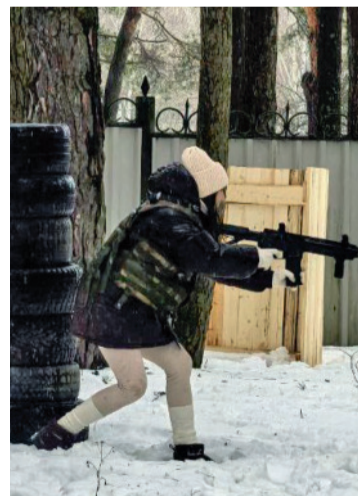
Лазертаг – игра метких и азартных.