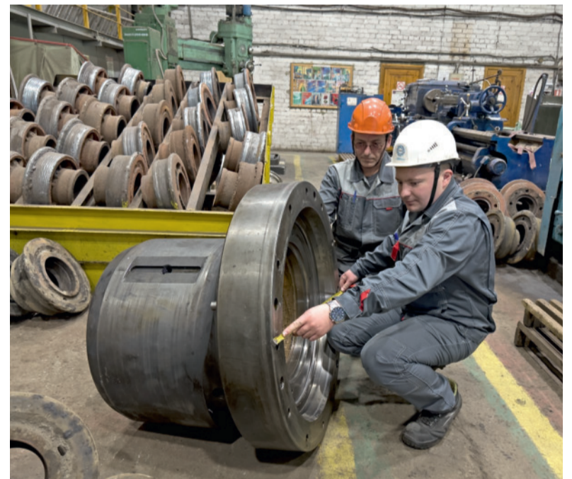
Инженерные идеи – на пользу дела.

– Пробуем проточить бронзовую втулку, запрессованную в эксцентрик, где из-за нагрева металла произошло сужение отверстия. Деталь массивная, важно прочно закрепить ее на токарно-винторезном станке