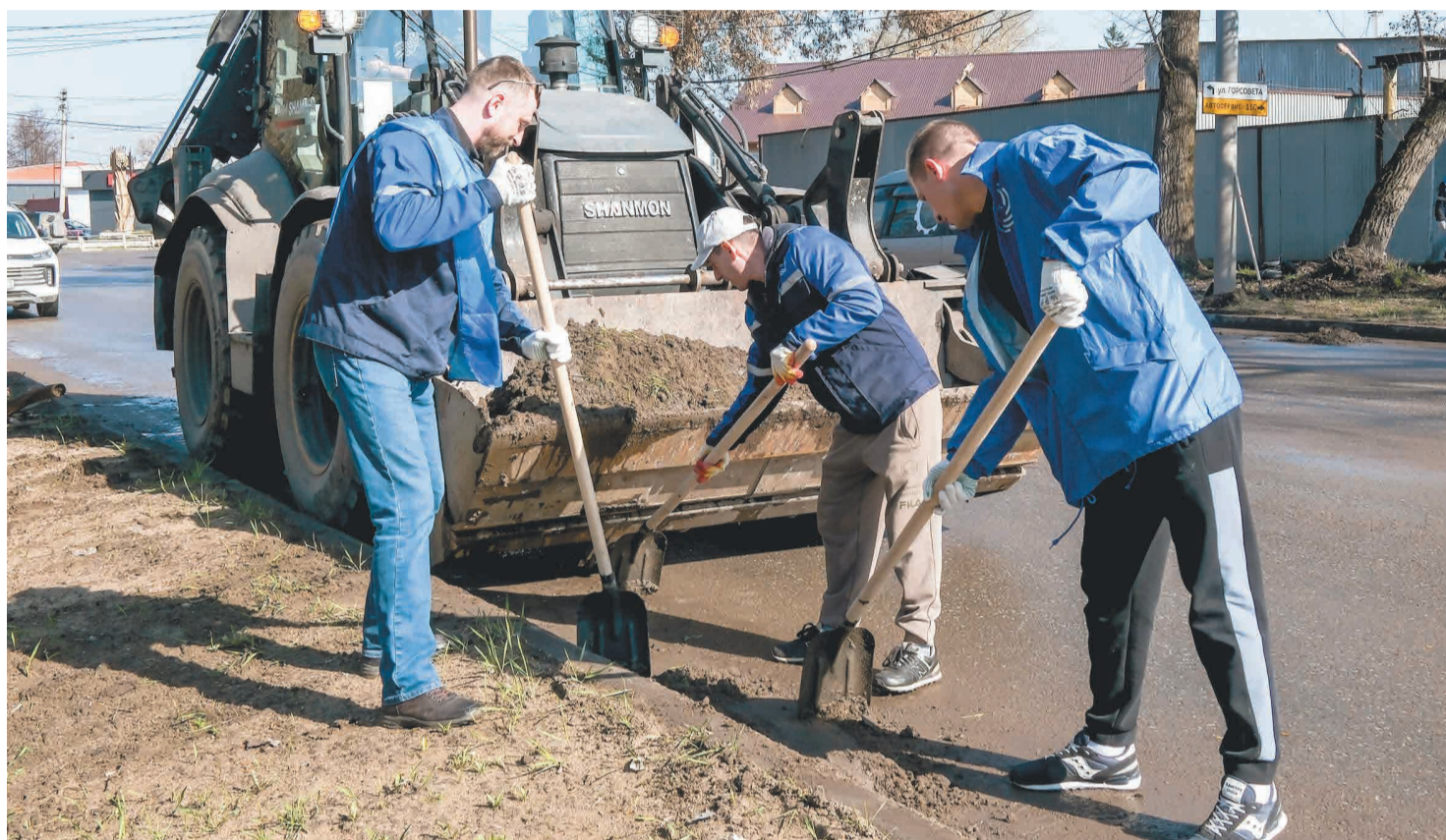
↑ 170 сотрудников Тулачермета приняли участие в субботнике.