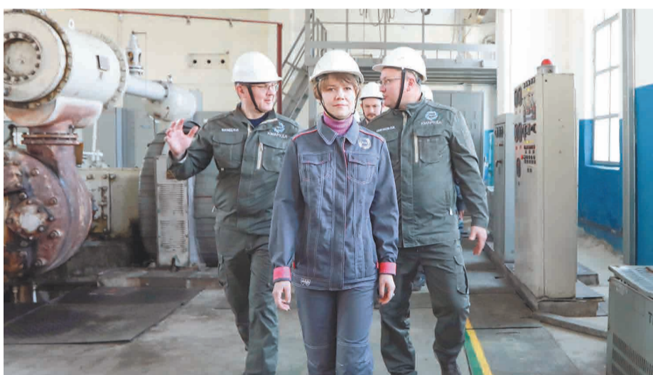
↑ Сертификаты соответствия методу 5С выданы шести объектам предприятия.