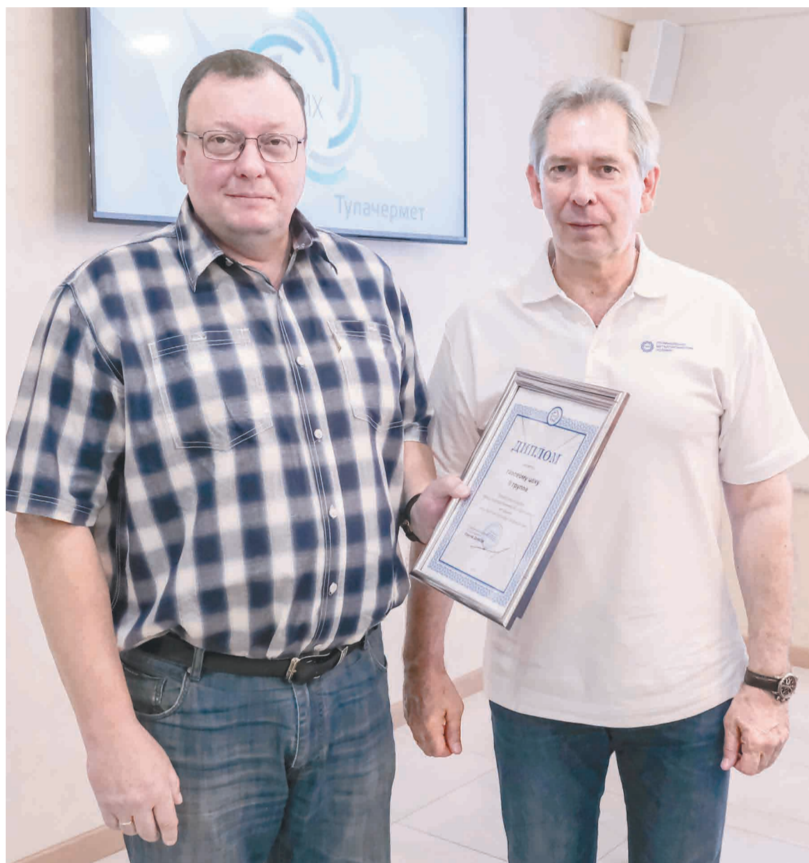
↑ Газовый цех становится призером конкурса уже не в первый раз.

На Тулачермете прошел конкурс ко Всемирному дню охраны труда