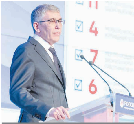
Дмитрий Миляев Губернатор Тульской области.

Г убернатор Тульской области Дмитрий Миляев принял участие во Всероссийской конференции «Демографический перелом в России: пути достижения» в Москве.