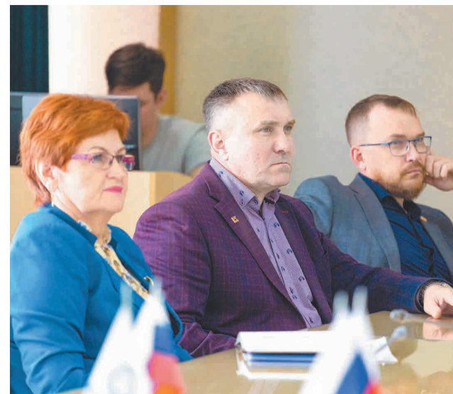
↑ На предприятии аудит был проведен в двадцатый раз.

По результатам аудита действие сертификатов, выданных ПАО «Кокс», было продлено. Это подтверждает, что предприятие успешно поддерживает и развивает систему менеджмента в соответствии с применяемыми стандартами.