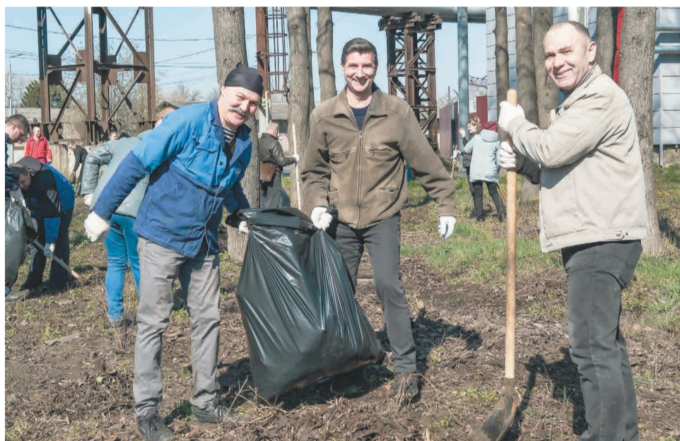
↑ Полевцы убрали 15 гектаров территории.