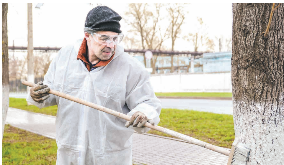
↑ Сталевары активно занимались побелкой деревьев.