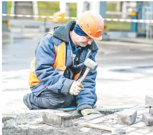
↑ Замена бордюрного камня.

Сотрудники Тулачермета, Промсорт-Тулы, ПМХ-Втормета и ПОЛЕМА принимают активное участие в благоустройстве территории