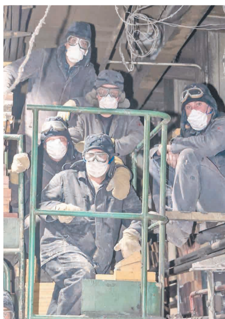
↑ Ремонт печного фонда продолжается.

В ремонте задействованы огнеупорщики коксового цеха, футеровщики (кислотоупорщики) СЦРКО № 2, привлекается техника и персонал автотранспортного цеха. Это позволит сохранить производительность коксовых печей и не допускать выбросов в окружающую среду.