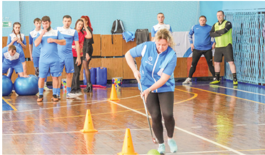
Угольщики принимают активное участие в спортивных состязаниях.

Ксения ХРАМЦОВА khramtova_ka@metholding.com