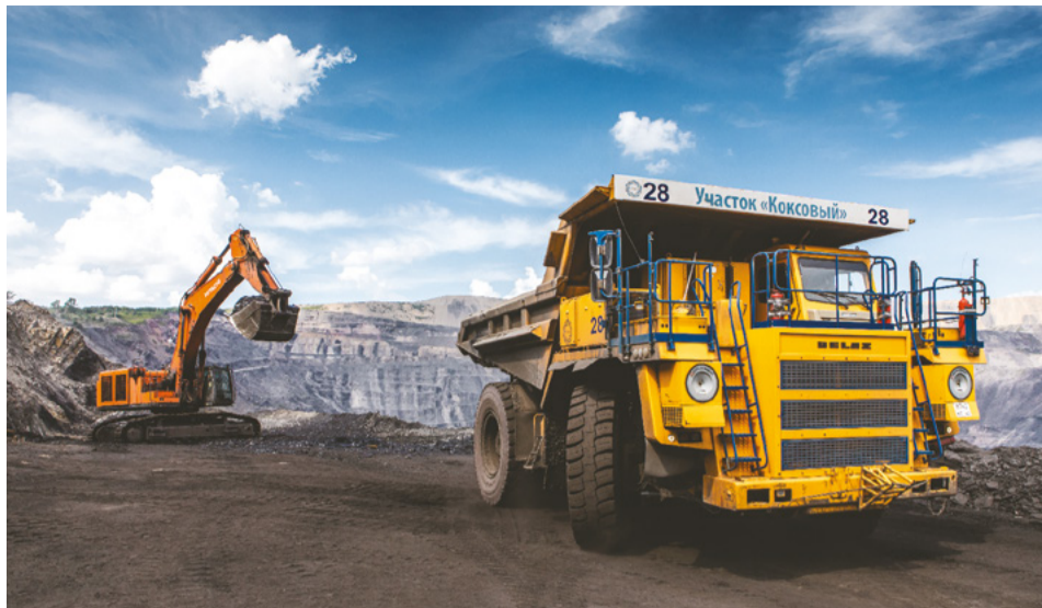
Безопасность на угледобывающем предприятии – превыше всего.