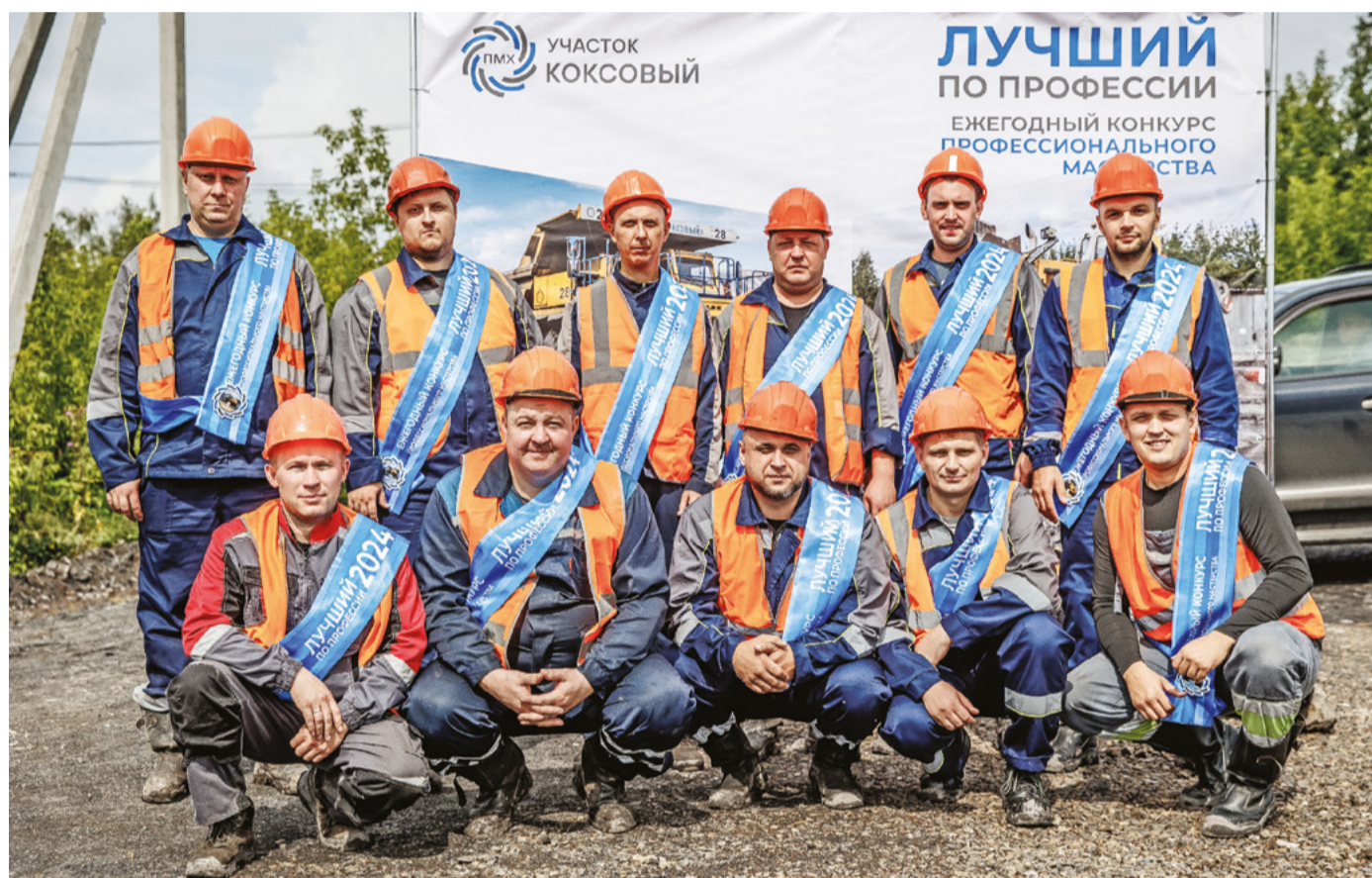
Лучшие водители и машинисты продемонстрировали свои умения на конкурсе профмастерства.