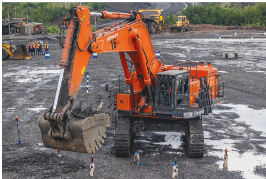
Соревнования на карьерной технике проходят очень зрелищно.