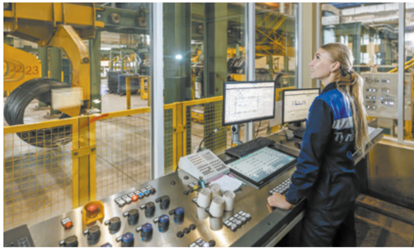
Повышение безопасности на производстве – в приоритете на всех предприятиях.