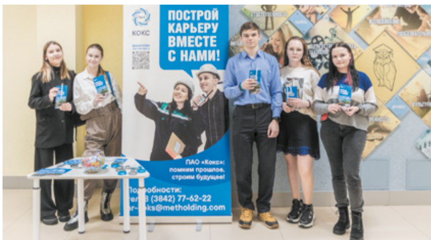
Старшеклассники поближе познакомилась с работой на производстве.

Следующее препятствие – престижность высшего технического образования. Выпускники школ,