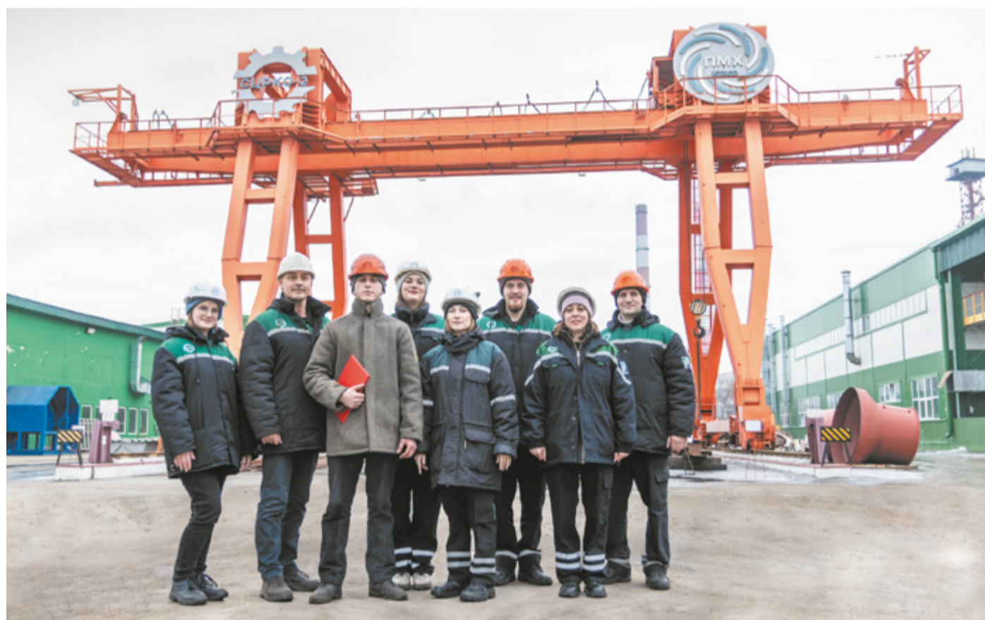
Молодые специалисты завода следят за соблюдением экологических норм.

Молодые специалисты завода проинспектировали специализированный цех по ремонту коксохимического оборудования № 2 на предмет соблюдения экологического законодательства.