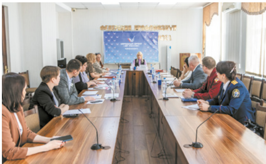
Совещание по вопросам экологии прошло под эгидой Народного фронта.

Представители ПАО «Кокс» приняли участие в совещании по вопросам осуществления контроля и надзора за состоянием атмосферного воздуха.