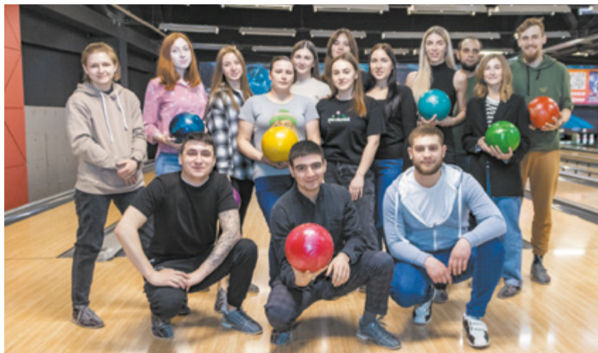
Обновлённый состав Совета молодых специалистов провёл соревнования.

По итогам соревнований, как всегда, победила дружба. Молодые специалисты получили заряд позитивных эмоций и новые знакомства. В конце мероприятия мужчины