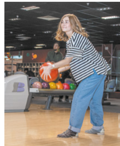
Боулинг – отличный тимбилдинг.

поздравили девушек с прошедшим праздником и вручили приятные и полезные презенты – подарочные сертификаты в спортивный магазин. Такие мероприятия нужны обнов-