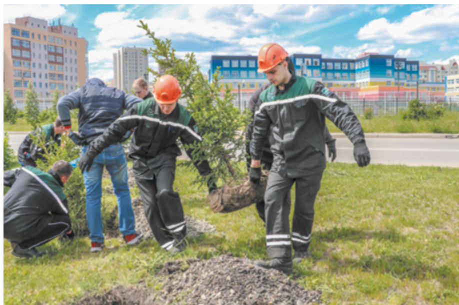
«Сад памяти» в Рудничном районе Кемерова заложили заводчане.

– Когда к нам приезжают гости с профильных предприятий, у всех первый вопрос: «А батареи вообще работают?» (улыбается). Работают, коллеги, работают! Про чистый