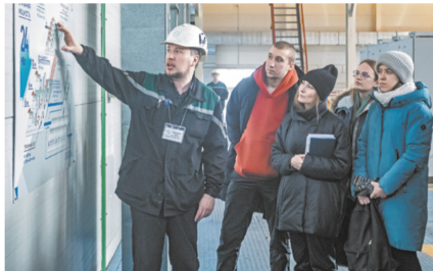
Работники, которые недавно устроились на завод, побывали в КЭС.

После полезных бесед работников провезли по производственной площадке. Замначальника авто-