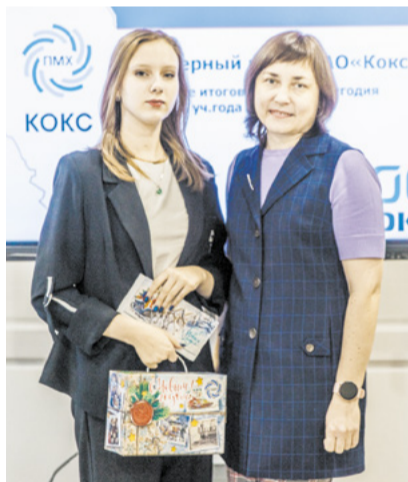
Стипендии и сладкие подарки получили ребята из инженерного класса.

На итоговом мероприятии 20 ребят из инженерного класса ПАО «Кокс» наградили именными стипендиями и сладкими новогодними подарками, презентами с брендированной продукцией отметили преподавателей дисциплин.