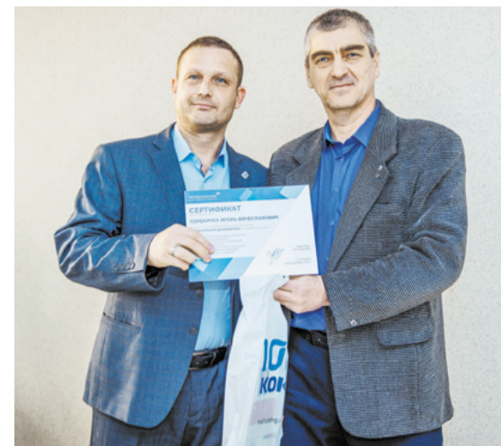
Руководителям тоже полезно узнать что-то новое.