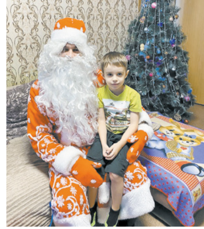
Помогли ребятам поверить в сказку.