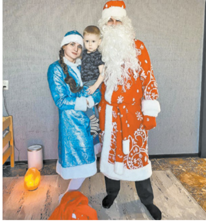
Дед Мороз и Снегурочка порадовали малышей.