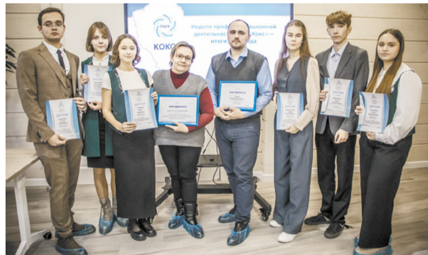
Отмечены юные участники НПК и олимпиад ПАО «Кокс».