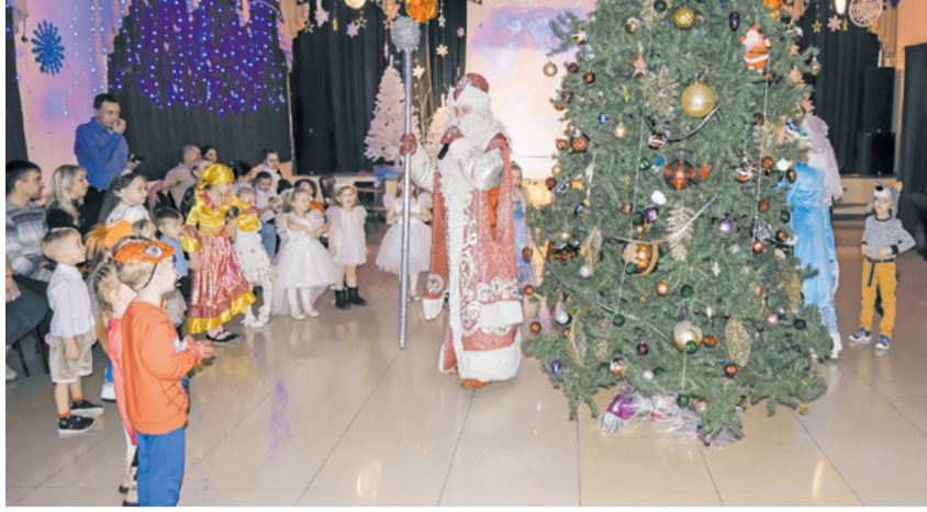
Весёлый новогодний утренник был организован для детей работников.