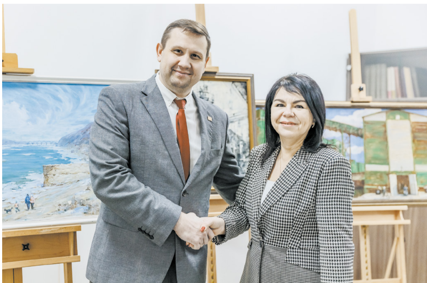
Полотна с изображением ПАО «Кокс» дополнили художественный фонд региона.