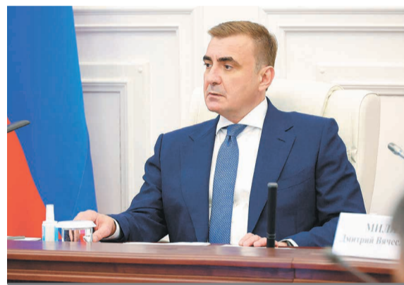
Алексей Дюмин Губернатор Тульской области.

Г убернатор обсудил итоги участия делегации Тульской области в XXVI Петербургском международном экономическом форуме (ПМЭФ).