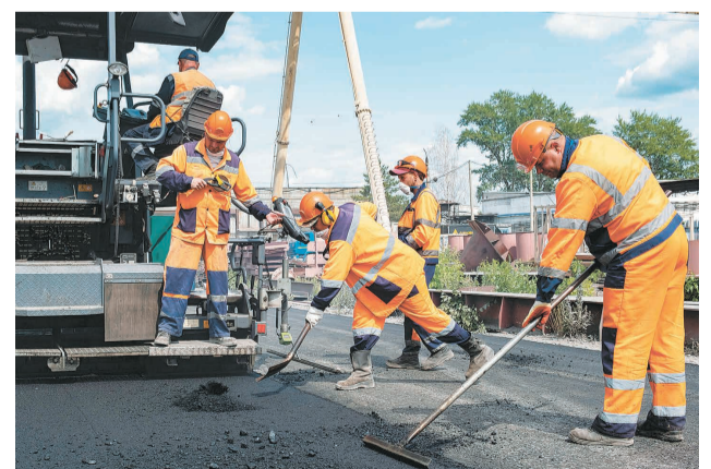
↑ Укладка покрытия на территории цеха обеспечения производством.

— Продолжается ремонт дороги возле РМЦ. Сейчас работы находятся на финальной стадии. После