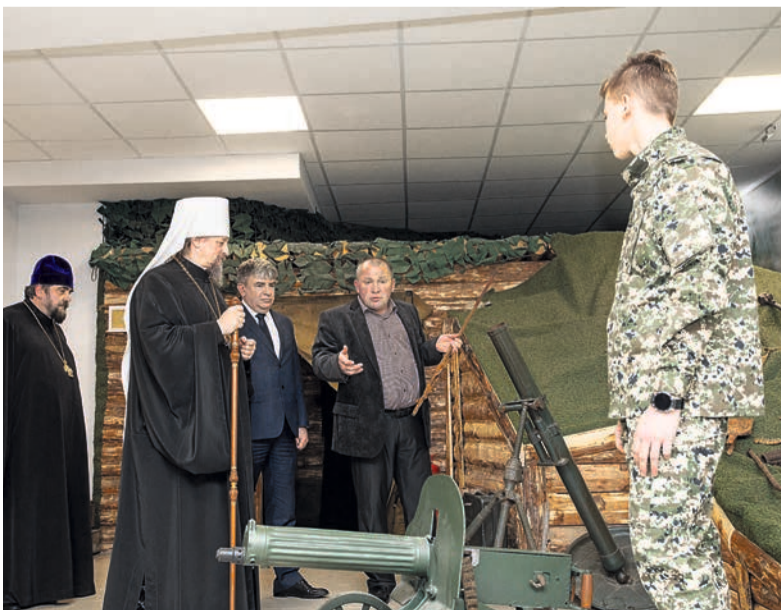
Владыка Иоанн осматривает экспозицию клуба. Декабрь 2019 г.

– Мы не говорим, что выложимся на 120%, а потом можно отдохнуть. Нет. Продолжим заниматься обычной работой: искать павших и готовить молодежь к Вахтам памяти.