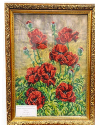
Бисерные маки лаборанта ЦОСТЛ Светланы Иванниковой вспыхивают алыми гранями.