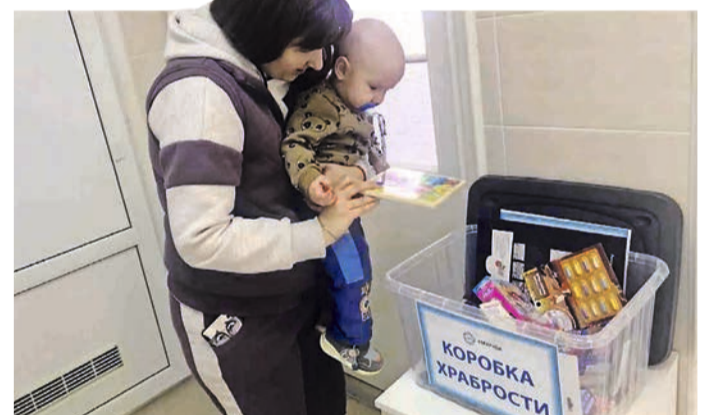
Выбрать подарок из «Коробки храбрости» = забыть о неприятностях и боли.