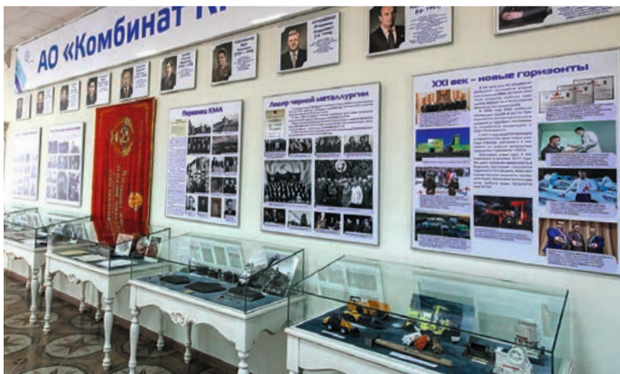
Выставочный зал АО «Комбинат КМАруда» в музее истории КМА.

учащаяся 8А класса школы № 28, г. Старый Оскол