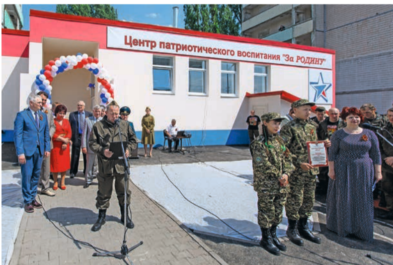
На церемонии открытия Центра патриотического воспитания «За Родину!». Май 2018 г.

В День Победы члены поисково-патриотического клуба «За Родину!» торжественно отпраздновали новоселье.