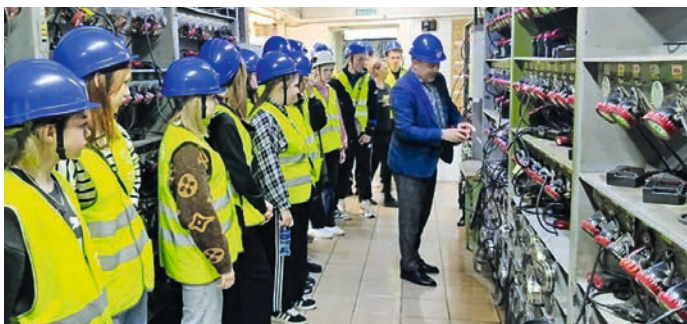
Девятиклассникам рассказали и показали устройство самоспасателя.

Гости пообещали, что вернутся на комбинат проходчиками, программистами и электромеханиками.