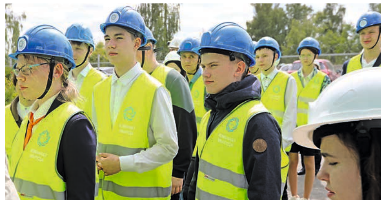
Будущие специалисты с интересом осматривают территорию предприятия.