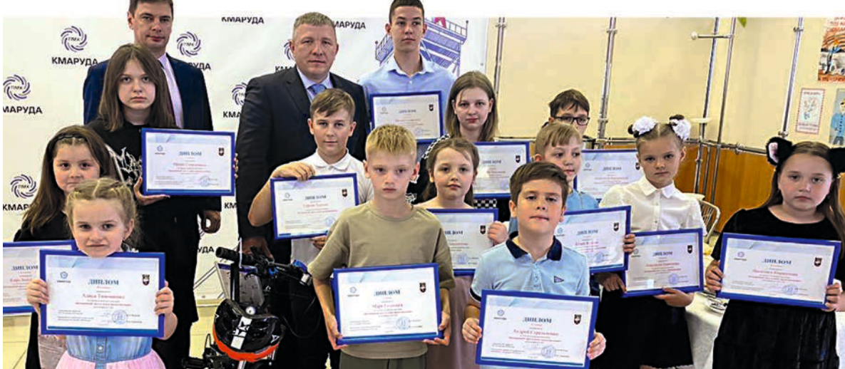
Участники II конкурса детского творчества ко Всемирному дню охраны труда.