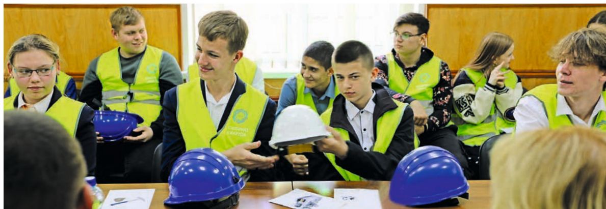
Передавая друг другу каску, школьники по очереди рассказывали о выбранной профессии.

– Меня впечатлило разнообразие профессий и сами руководители предприятия, их истории успеха. Экскурсия очень понравилась. Мне интересна работа на производстве, особенно профессия маркшейдера.