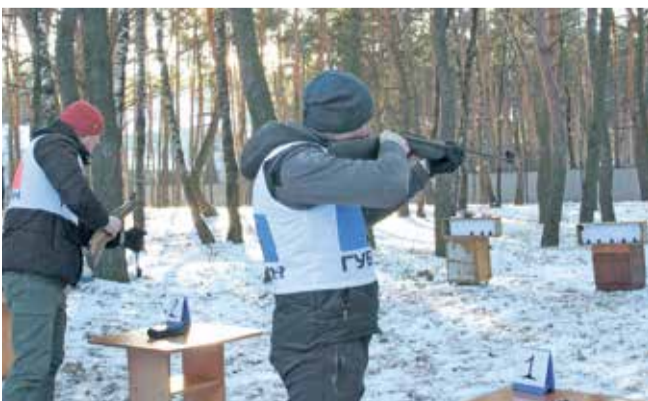
На этапе стрельбы