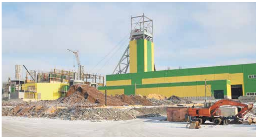
На строительной площадке клетового ствола