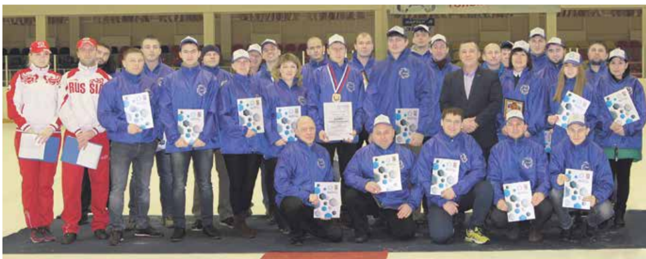
Лучшие спортсмены и организаторы мероприятия