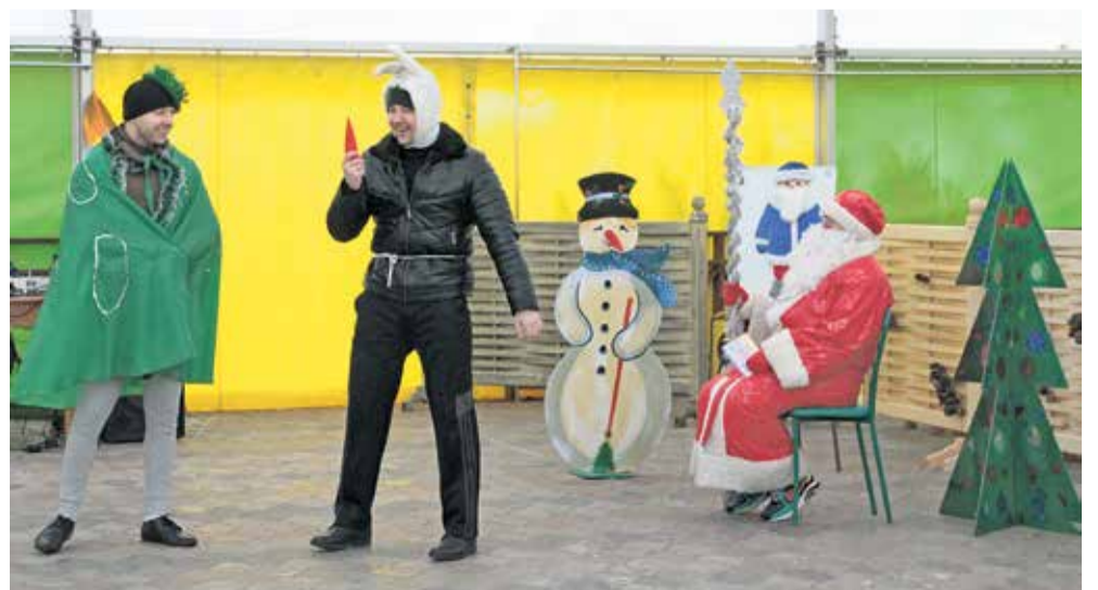
Комбинатовцы с удовольствием перевоплотились в сказочных персонажей