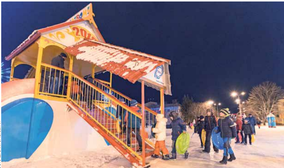
Горка в центре города – любимая забава детворы

– Теперь участок в рамках выполнения инициированного губернатором проекта «Управление здоровьем» называется медицинским округом. Специалист будет обслуживать не как раньше – всех, кто прописан на его участке, а строго по регламенту: на одного семейного доктора в городе теперь приходится две тысячи человек, в селе – не более полутора тысяч. Штат медиков вырастет. У нас появилось 56 ме-