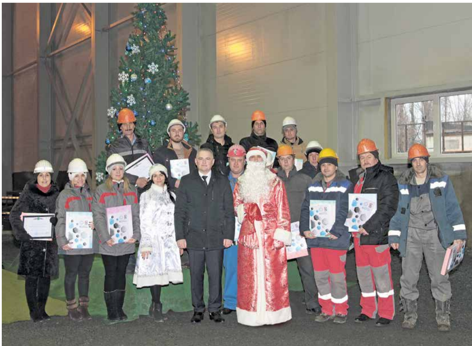
Накануне нового года наградили отличившихся при строительстве клетового ствола