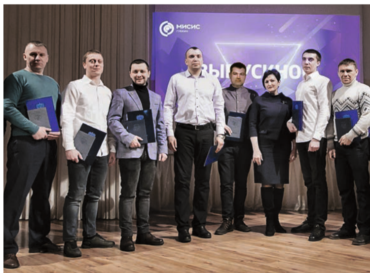
Горные инженеры КМАруды - знания на пользу комбинату

Работники КМАруды получили дипломы о высшем профессиональном образовании Губкинского филиала НИТУ МИСИС.