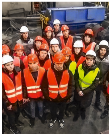
Первокурсники Губкинского горно-политехнического колледжа на экскурсии в ремонтно-механическом цехе