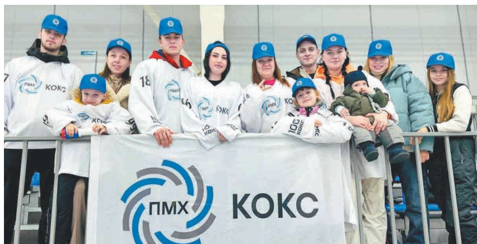
↑ Главная сила команды — на трибунах.

Этот матч еще раз доказал, что спорт объединяет людей, а хоккей остается одним из самых любимых видов. Пусть эта победа со счетом 5:3 станет отличным началом Нового года для команды «Кокс», которая будет дарить болельщикам яркие эмоции весь сезон!