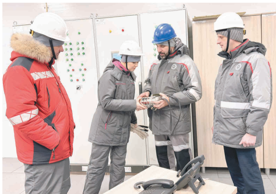
↑ Восемь шахтных объектов соответствуют стандартам 5С и визуализации.