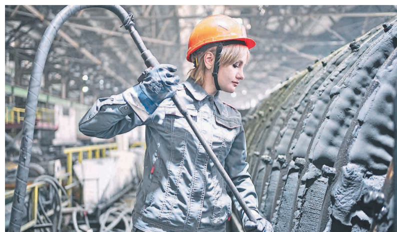
← Новый рекорд — результат командной работы.