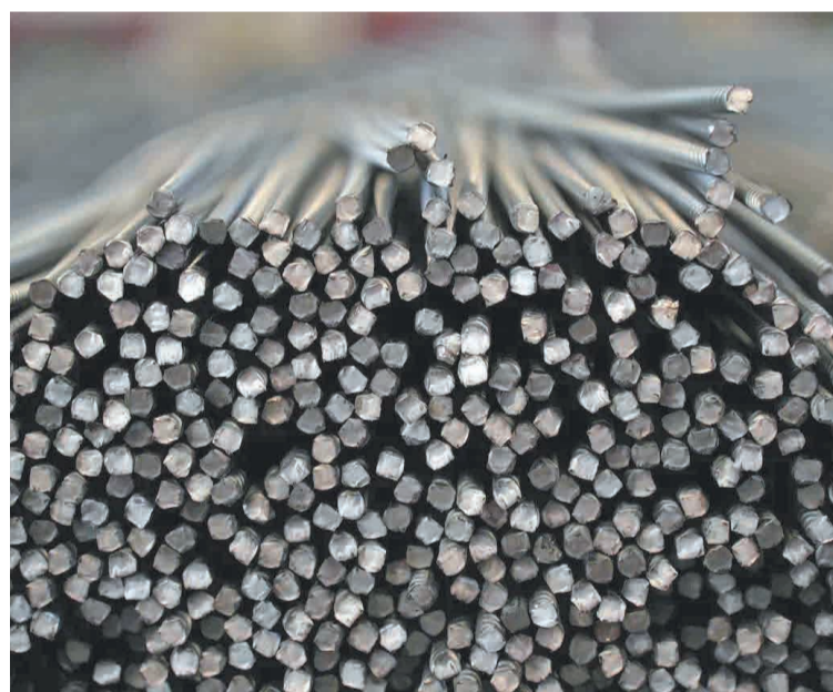
← Во II полугодии 2025 года Промсорт возглавил рейтинг ведущих российских поставщиков сортового проката.