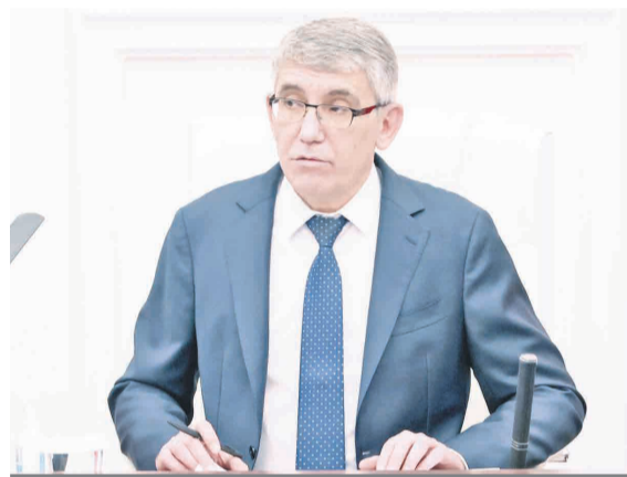
Дмитрий Миляев Губернатор Тульской области.

П одведены предварительные итоги реализации национальных проектов и государственных программ в регионе в 2025 году.