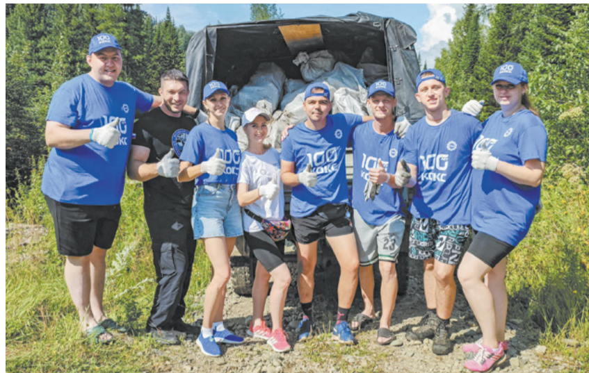
Коксохимики внесли большой вклад в уборку.

Уже через час специалисты ехали в электричке. Под мерный стук колёс путешественники любовались дивными видами за окном: