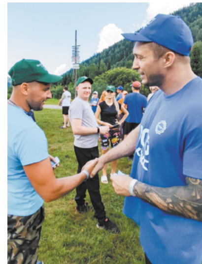
Налаживание связей с командами.