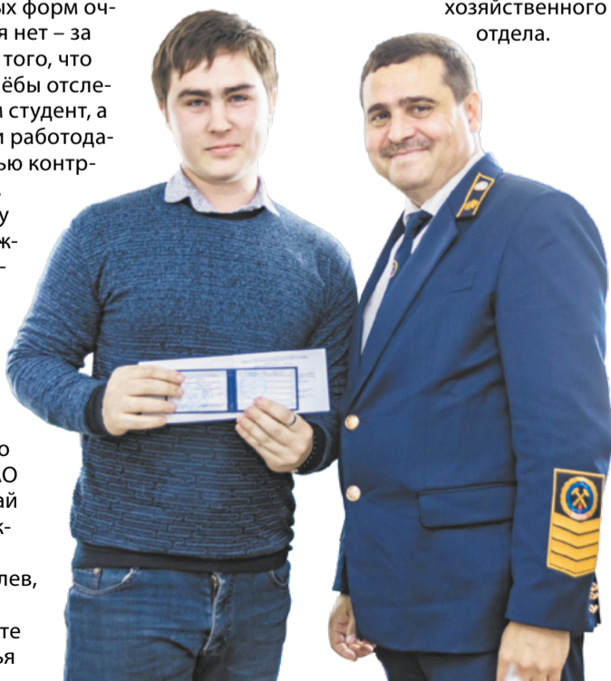
Студентами КузГТУ стали 14 коксохимиков.