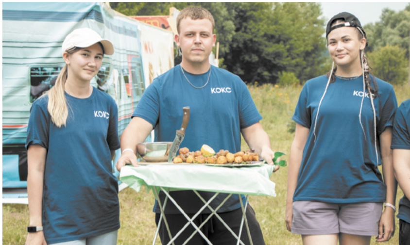
Конкурсное блюдо заводчан признали одним из лучших.

Затем прошло торжественное посвящение новичков и