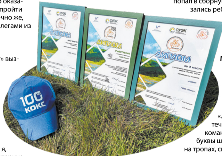
Команду ПАО «Кокс» отметили дипломами.

От талькового месторождения по узкой лесной тропинке, шлёпая по размытой дождём глине, мы отправились к тремолитовым останцам, возвышающимся на высоту