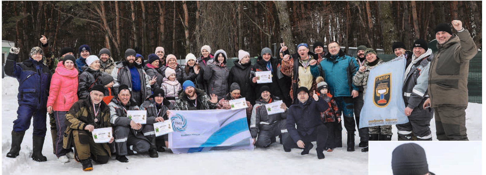
Команда клуба рыболовов комбината КМАруда

Лидером соревнования с заметным отрывом стала команда