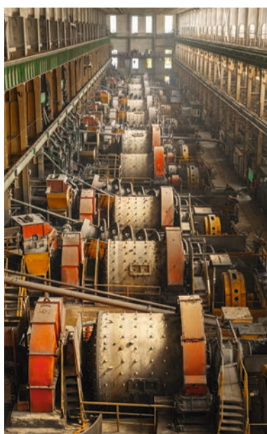
Мельничный пролет ДОФ