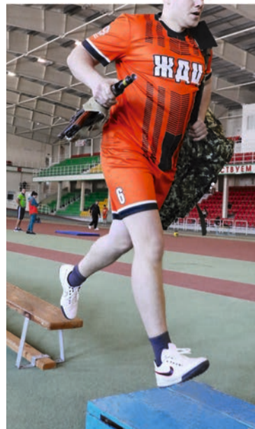
Преодоление полосы препятствий