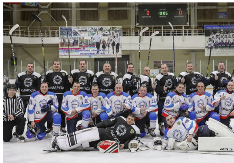
Команда управления «Горняк» – триумфатор хоккейного товарищеского матча!

Три периода напряженной борьбы, яростных голевых атак и острых моментов – и встреча на льду команд управления «Горняк» и шахты «Шахтер» завершилась со счетом 5:2.