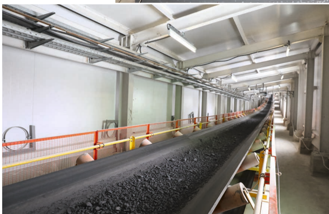
Протяженность тракта подачи руды до перегрузочного узла ДОФ составляет примерно 350 м

На горизонте – 250 м. в комплексе дробления происходит первичная переработка руды