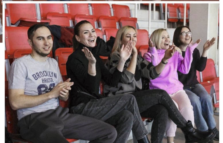
Активные болельщики из управления закупок