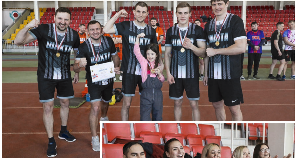
Победители соревнований – шахтеры