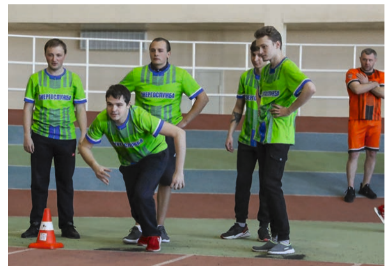
На старте эстафеты – команда энергослужбы