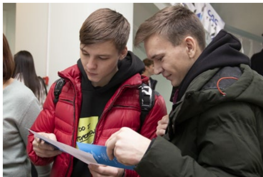
На ярмарке вакансий соискатели знакомятся с условиями работы на заводе.