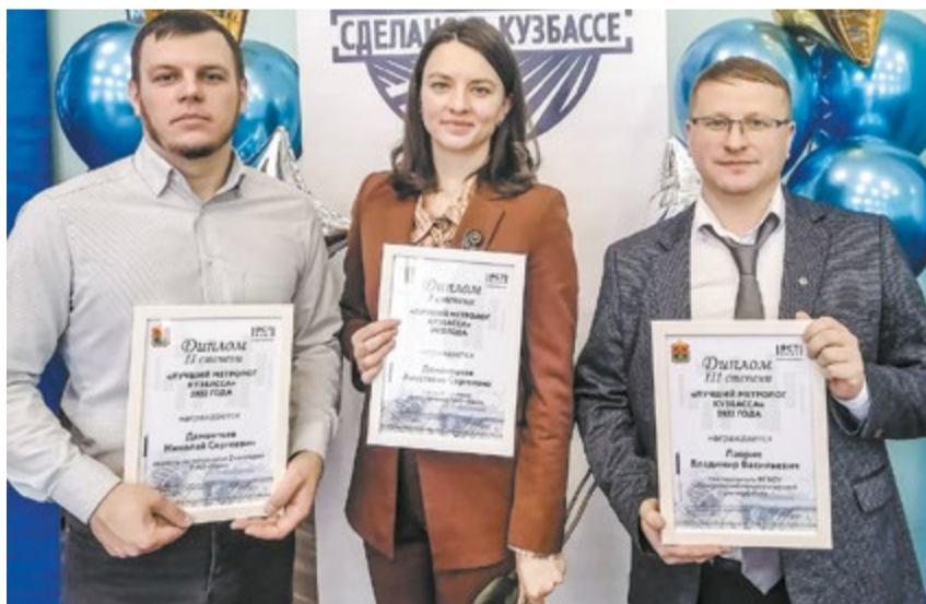
Работники ЦМА – в лидерах конкурса «Лучший метролог Кузбасса».

Работники ЦМА взяли призовые места в профессиональном конкурсе.