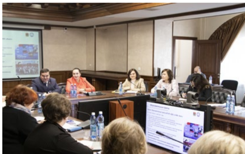
Образование и промышленность разрабатывают совместные решения кадрового вопроса.