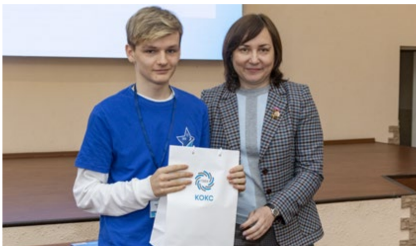
Авторы лучших решений кейса от завода получили призы.