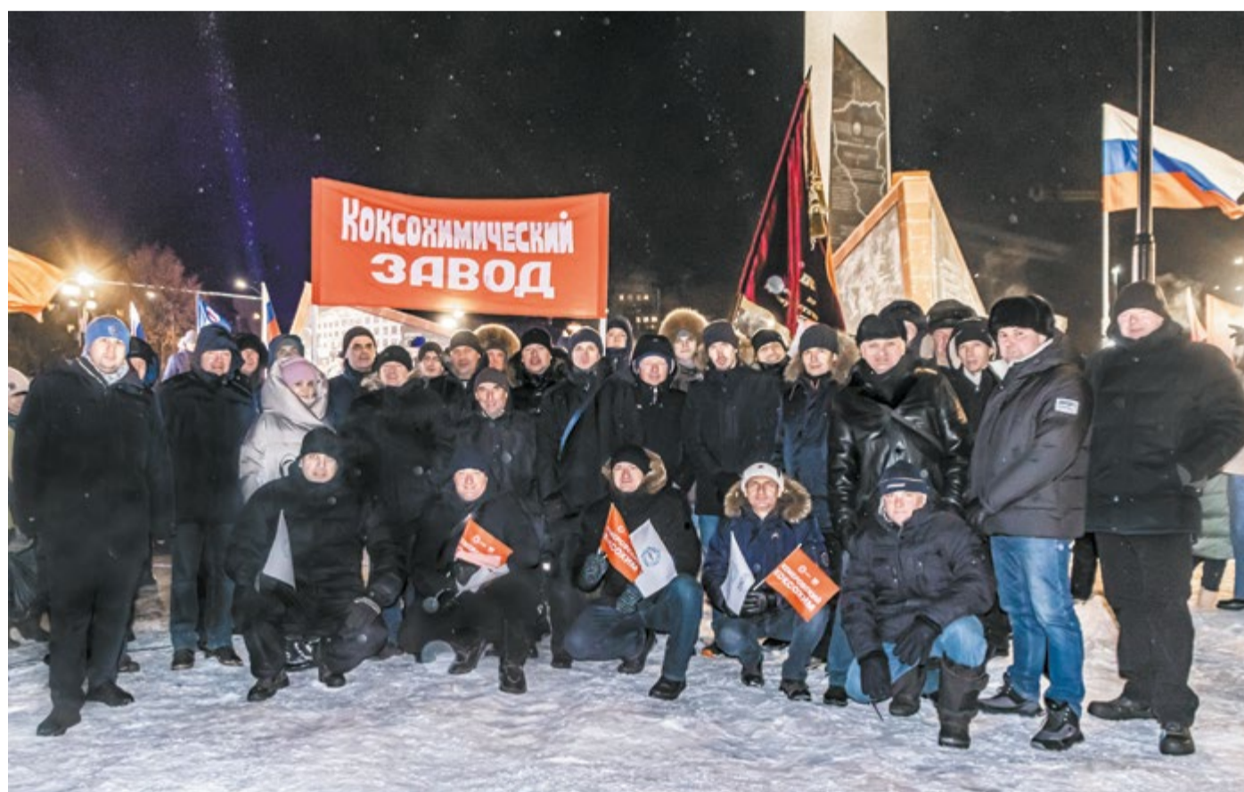
Делегация коксохимиков приняла участие в открытии стелы «Город трудовой доблести».