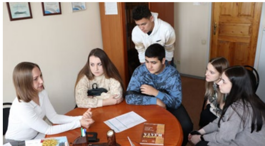
Студенты познакомились с работой экономического отдела.

Будущие экономисты не только познакомились с работой подразделения, но также пообщались