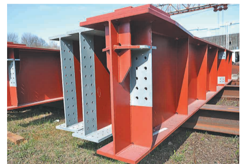
Балочная система полностью готова.

О на будет использоваться для строительства Универсального спортивного комплекса в Москве. Общий объем проекта — 315 тонн.