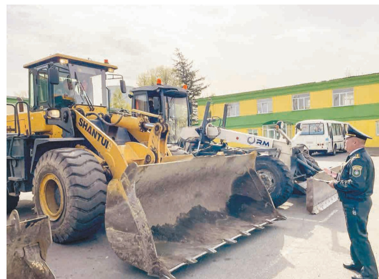
↑ Осмотр состояния машины.