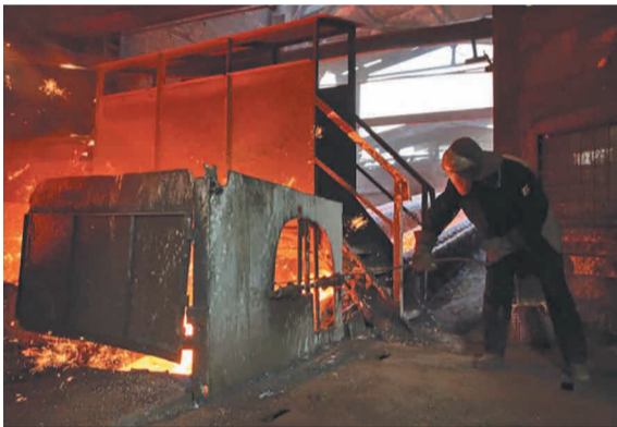
Участок разливки чугуна.

В 2006 году на ДП-2 было завершено строительство блока высокотемпературных воздухонагревателей конструкции ЗАО «Калугин». Новый блок позволил обеспечить работу печи на трех кауперах вместо четырех, существовавших на ДП-1 и ДП-3, повысить температуру дутья до 1200 градусов С, а также обеспечить практически полное сжигание топлива и снизить выбросы окиси углерода в окружающую среду. За счет замены кожухов воздухонагревателей было повышено давление под колошником до 1,5 кг/см 2 . Срок эксплуатации воздухонагревателей увеличен до тридцати лет. В 2007 году во время капитального ремонта на ДП-2 установлен влагомер производства австрийской фирмы «Berthold», позволивший корректировать загрузку в печь кокса в зависимости от его влажности. Процесс стал осуществляться автоматически, так как прибор был включен в систему АСУ ТП.