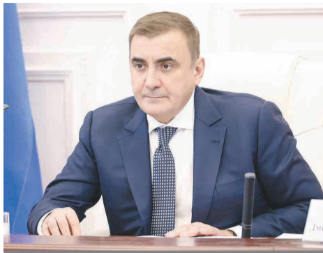
Алексей Дюмин Губернатор Тульской области.

На еженедельном оперативном совещании Губернатор Алексей Дюмин рассмотрел обращения жителей региона.