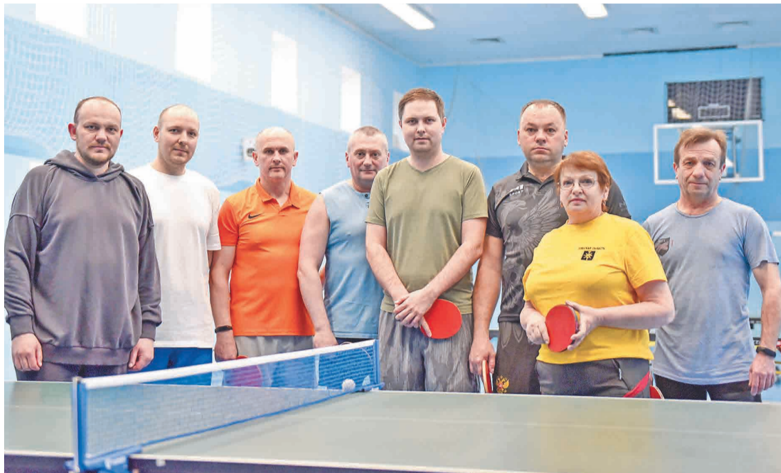
↑ Участники турнира по настольному теннису в группе В.