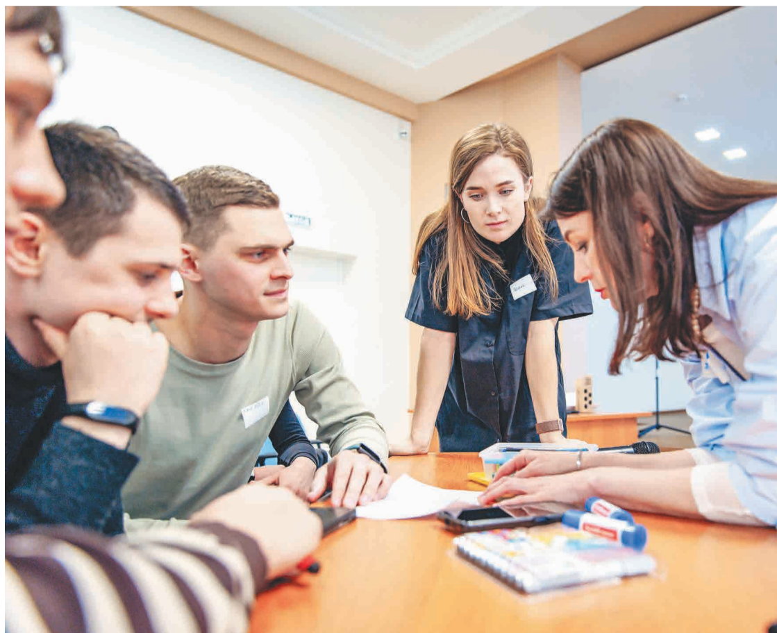
← Победитель конкурса удостоится золотого нагрудного знака и именной премии Бориса Давыдовича Зубицкого.