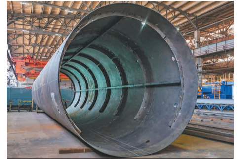
Металлоконструкция для ДП-3.

Т акой объем необходим для капремонта ДП-3, запланированного на декабрь этого года. На выполнение заказа щекинскому заводу потребуется порядка 8 месяцев.