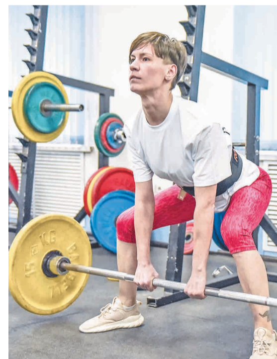
↑ Женское первенство — украшение троеборья.