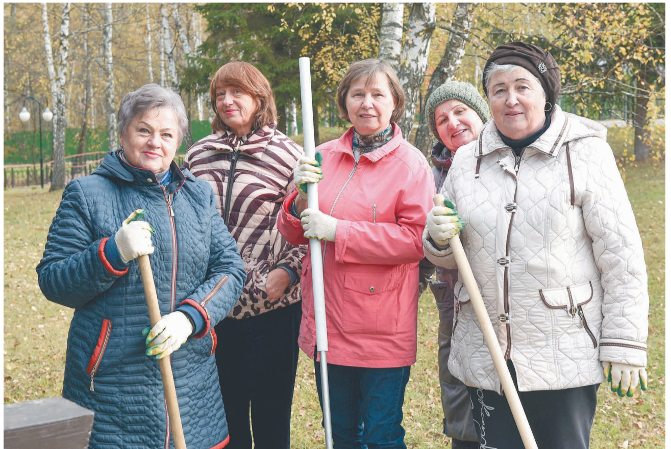
↑ Чист и воздух, и газоны.