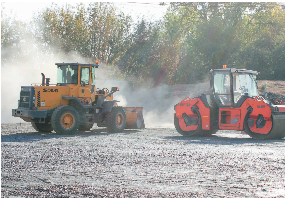
↑ Строители изменили схему пешеходных дорожек с учетом траектории перемещения работников.