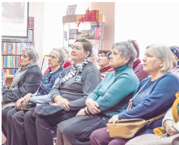
На пенсии есть время для самообразования.

— Потрясающе интересная лекция. Уникальная возможность узнать много интересных фактов сразу о многих русских знаменитостях. Каждый раз радуюсь возможности восполнить те пробелы в знаниях, которые остались со времен молодости. Сейчас, на пенсии, есть время заняться самообразованием и глубже погрузиться в любимую мной эпоху расцвета русской культуры. Когда приду домой, обязательно еще раз открою томик стихов!