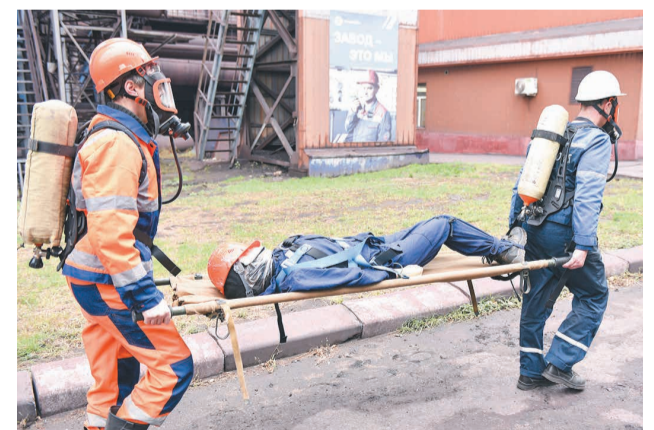
↑ Комиссия высоко оценила действия участников учения.

В ходе учений аппаратчик газоочистки № 2 доложил о сложившейся обстановке старшему диспетчеру ПТО и в дежурно-диспетчерскую службу АСС. Диспетчер оперативно вызвал к месту ЧС все дежурные смены, находящиеся в постоянной готовности. Дежурная смена газового цеха четко выполнила свою задачу. Газоспасатели, проведя разведку зоны ЧС, обнаружили и эвакуировали в безопасное место двоих «пострадавших», оказавшихся в загазованной зоне, и передали их бригаде скорой медицинской помощи. Мобильная группа ЧОП «ПромБезопасность» организовала охрану общественного порядка в районе газоочистки № 2. Дежурная смена пожарной охраны после развертывания оборудования находилась в готовности к ликвидации очага возгорания. Аварийно-спа-