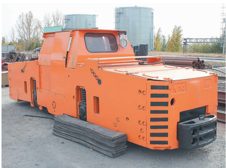
↑ На участках шахты задействовано 83 электровоза.