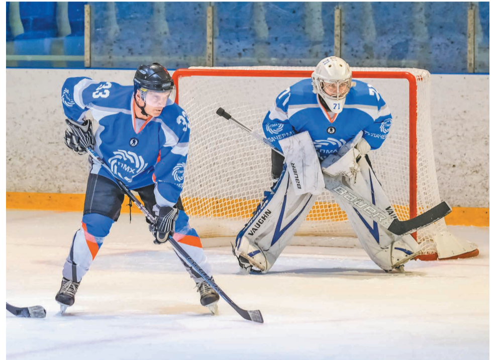
↑ До конца первого круга нашей команде предстоит провести еще четыре игры.

В целом, по результатам пяти проведенных игр наши хоккеисты одержали три победы, один матч сыграли вничью и одну встречу проиграли. Это матч с командой «ЦКБА», сильными и опытными соперниками, давними участниками НХЛ. Теперь ребятам предстоит встретиться с командами «Белые лебеди», «Легенда», «Евраз» и «Хулиганы», после чего первый круг будет завершен.