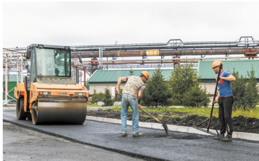
Рядом с гаражом большегрузной техники заасфальтировали площадку.