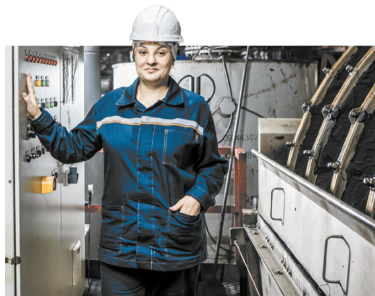
Социальная ответственность перед работниками – принцип ПМХ.

– Социально-трудовые отношения между работодателем и сотрудниками на предприятии регулирует коллективный договор на 2022-2024 годы. Этот документ предусматривает много бонусов для работников. Так, сотрудник, проживающий в частном секторе, ежегодно может получать около 7,8 тонны угля, либо компенсировать затраты на его приобретение в этих объёмах у сторонних организаций. Раз в квартал, по заявлению работников, проживающих в квартирах,