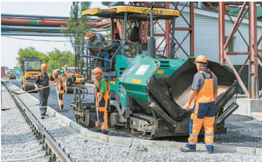
Дорога возле управления ЦУХПК № 1 стала удобнее.