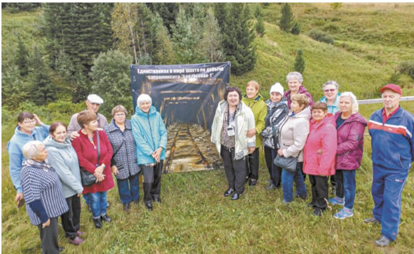
Ветераны ЦОФ «Берёзовская» познакомились с достопримечательностями Барзаса.