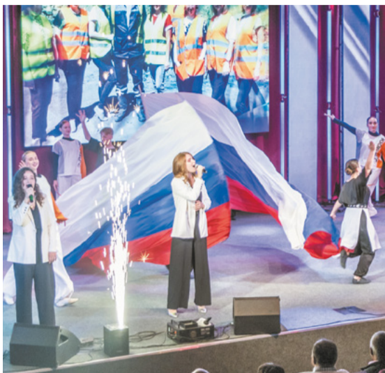
Праздничный концерт в День шахтёра в Киселёвске.