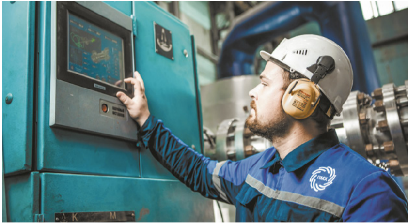
Кислородный цех подводит итоги работы за 75 лет.

Запущенная меньше года назад в эксплуатацию воздухоразделительная установка КА- 27/5 – один