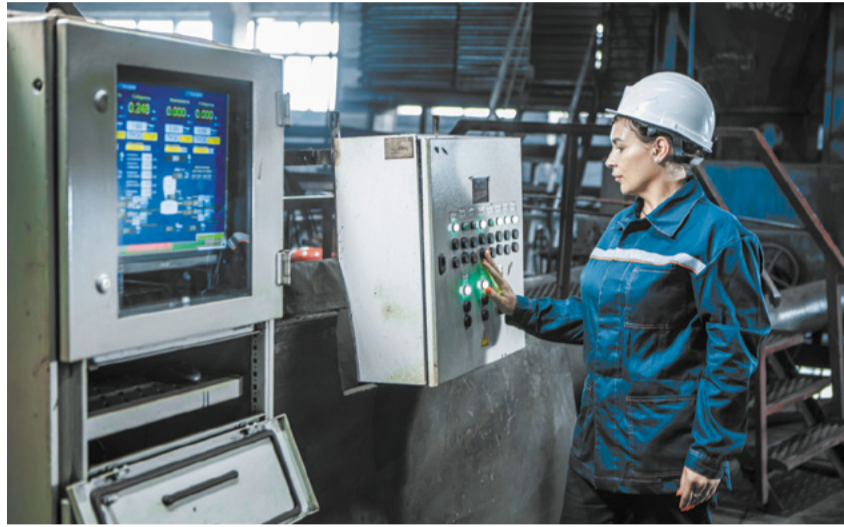
Обновление оборудования на фабрике продолжается.