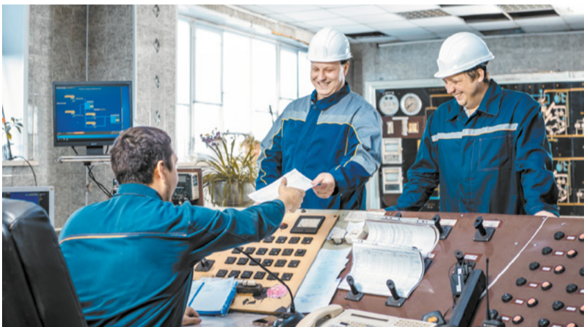
Хорошие коллеги и забота предприятия – гарантия стабильности.

Ежегодно десятки сотрудников фабрики по заявлению получают адресную материальную помощь на жизненно важные нужды. В этом году УК «ПМХ» выпустило положение о нескольких новых видах стимулирующих выплат для работников со стажем, а также новых сотрудников.