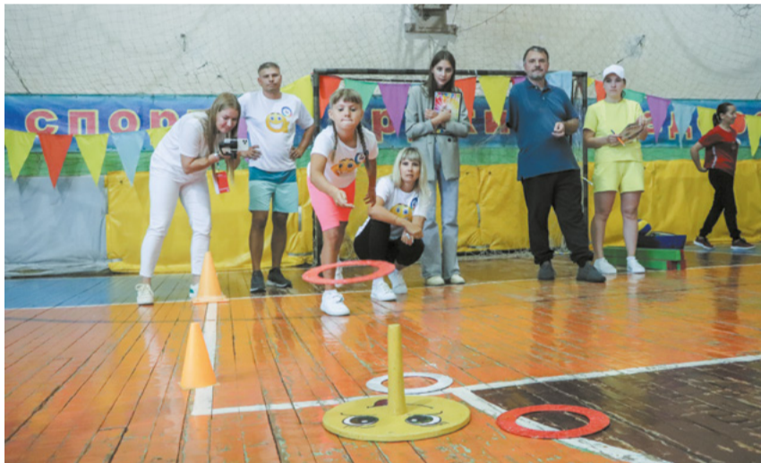
Семейный праздник для работников фабрики прошёл накануне Дня шахтёра.

Праздник «Мама, папа, я – дружная, спортивная семья» прошёл для сотрудников АО «ЦОФ «Берёзовская».