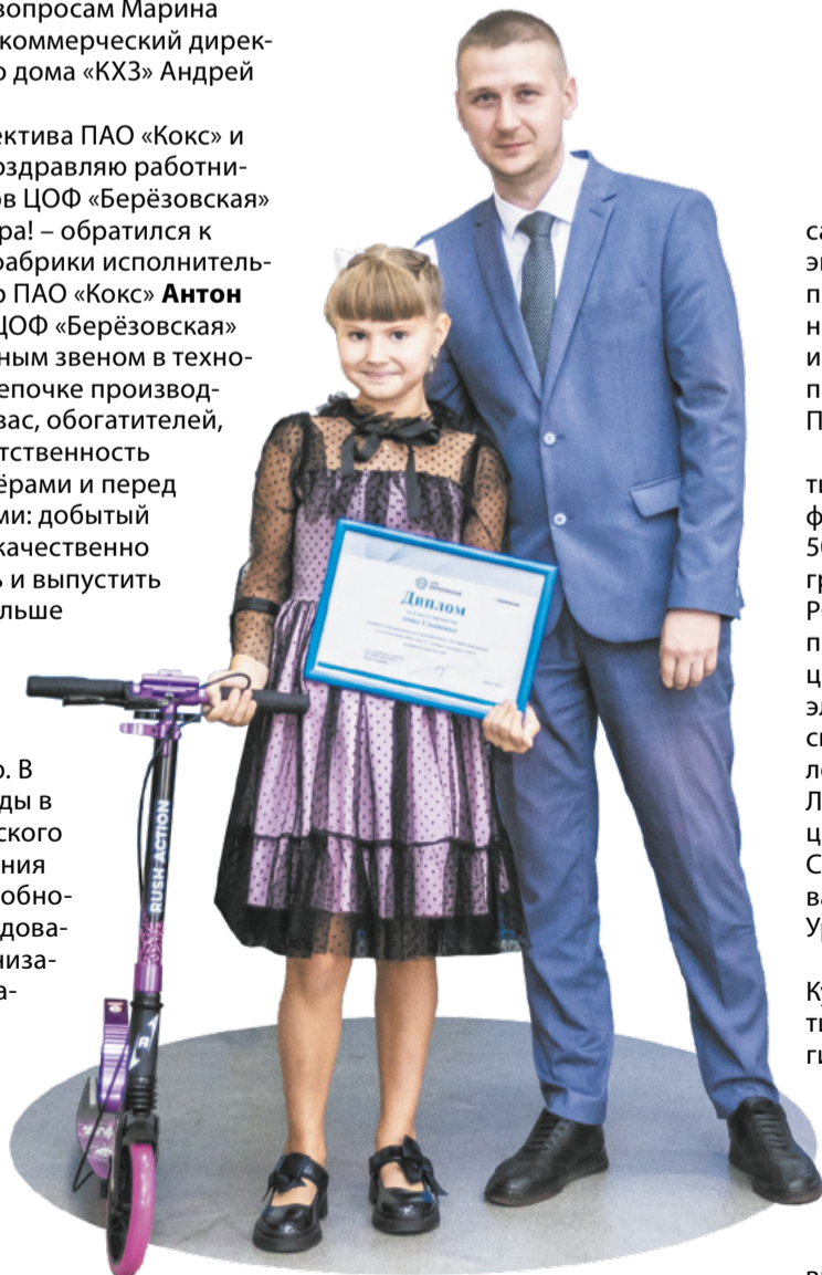
Юные победители семейного конкурса получили подарки.

В холле героев и гостей праздника ожидал традиционный фуршет, подготовленный поварами фабрики.