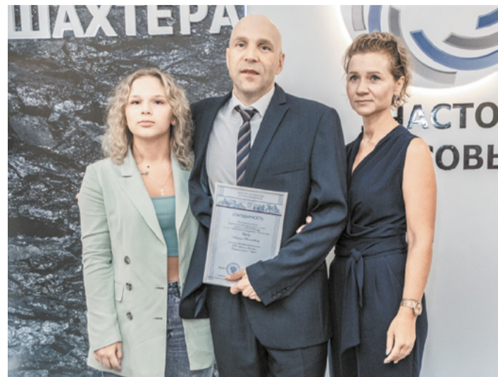
Более 80 наград получили горняки участка «Коксовый».

плекса и инфраструктуры. Все эти высокие достижения невозможны без сплочённого коллектива. Люди – это самый главный актив ПМХ. У предприятия большой потенциал, запасов угля участка «Коксовый» хватит на многие десятилетия. Вы приносите огромную пользу не только региону, но и всей стране.