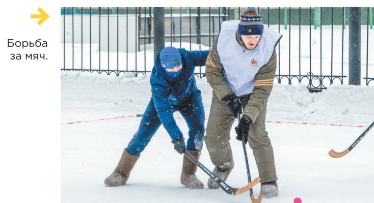
→ Борьба за мяч.