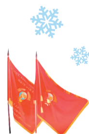
Памятное Красное Знамя в честь 50-летия Советской власти Памятное Красное Знамя к 100-летию со дня рождения В.И. Ленина