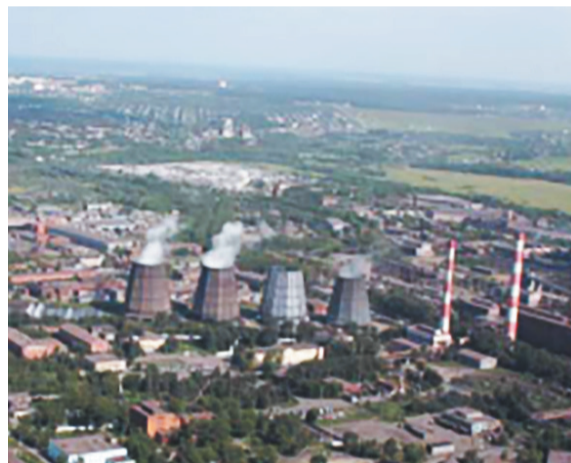
Вид на завод с высоты птичьего полета. 90-е годы.

В прочем, на тот момент это так не виделось. Ведь даже побывавший в сентябре 1992 года на Тулачермете исполняющий обязанности главы правительства России Егор Гайдар остался доволен масштабом перемен металлургического гиганта. Гостю показали все виды производимой продукции — начиная с основной, включая АПК, и завершая товарами народного потребления. Рассказали о происходящей структурной перестройке, программах акционирования и производства товаров народного потребления. Будущий премьер-министр России был очень впечатлен и сказал, что теперь учиться акционированию будет всех посылать в АК «Тулачермет». Членам его делегации, кстати, очень понравился открытый при заводе магазин «Супермаркет», где они купили два пылесоса.