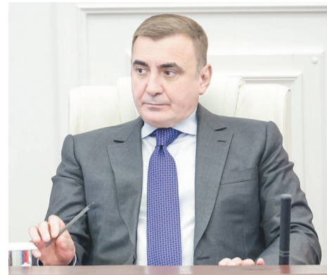
Алексей Дюмин Губернатор Тульской области.