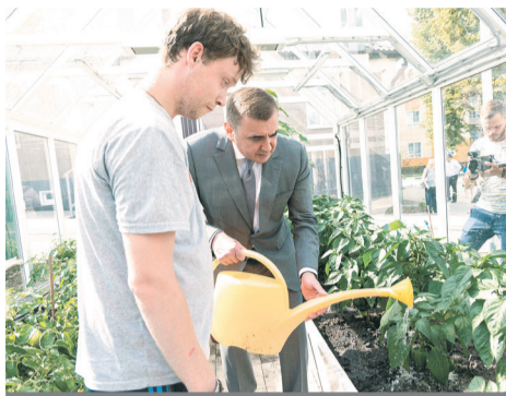
Алексей Дюмин Губернатор Тульской области.

А лексей Дюмин посетил «Дом моих возможностей» для реабилитации инвалидов.