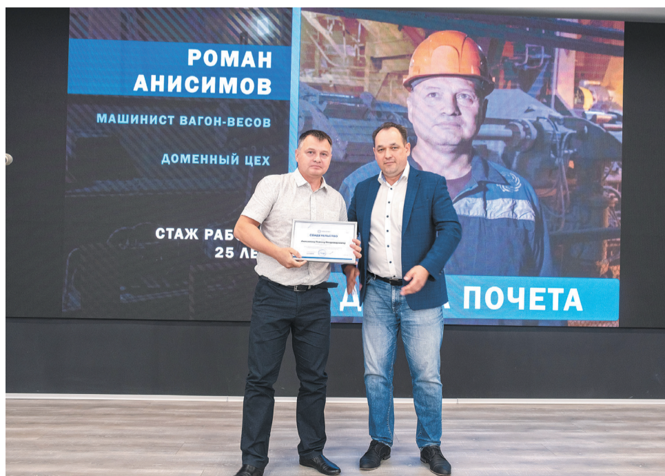
↑ По традиции, 20 сотрудников Тулачермета занесены на заводскую Доску почета.

— Я устроилась на предприятие в 2015 году, когда еще сваи забивали. И тогда мы, специалисты производства, были диспетчерами стройки. Награда стала для меня неожиданностью, очень волнительно. Я люблю свою работу, здесь много нового. Тула-Сталь — это инновационное производство и интересные люди.