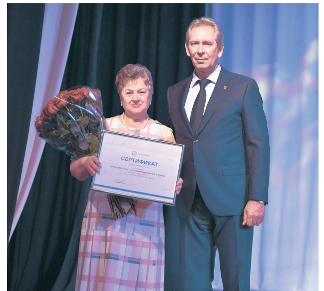
↑ Ветеранам вручили сертификат на посещение музея-заповедника С.А. Есенина.