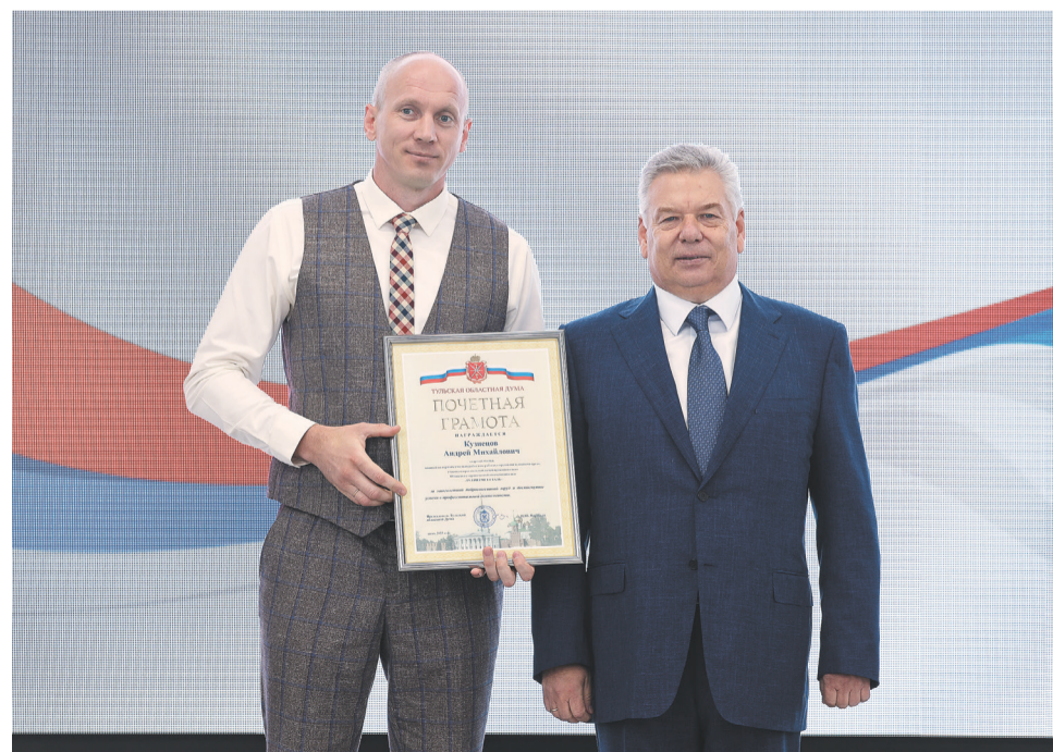
↑ Председатель Тульской областной Думы Николай Воробьев отметил значимость металлургии для области.