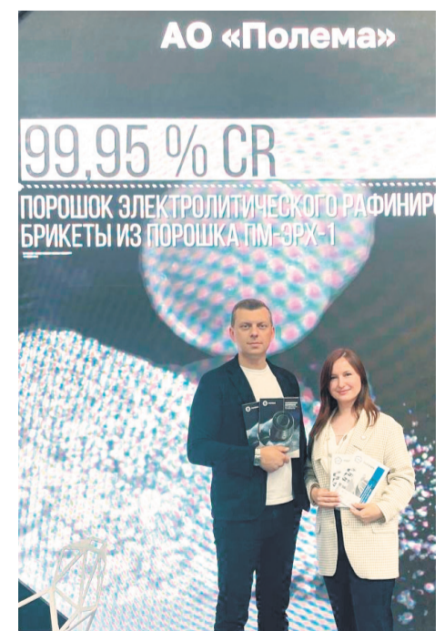
↑ Представители делегации.

ИННОПРОМ — главная промышленная выставка России, объединившая производителей и байеров со всего мира. По заверению организаторов, площадка позволит обновить не только партнерские сети, но и переосмыслить базовые принципы работы