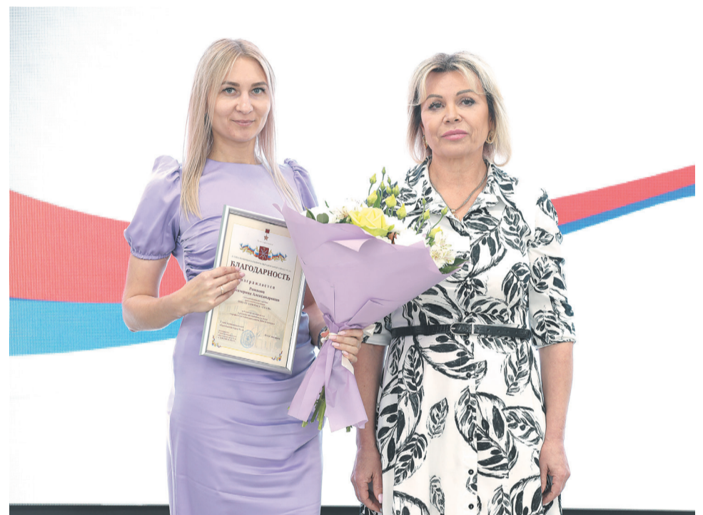
↑ Глава города Тулы Ольга Слюсарева отметила выдающихся сотрудников.