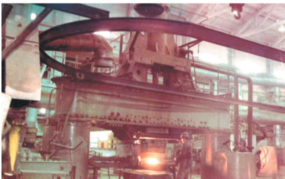
Операцияковки на молоте.

Для производства в объединении ЗИЛ высококачественного литья из ковкого чугуна в НПО «Тулачермет» была разработана и внедрена технология производства высокомарганцовистого чугуна с содержанием марганца до 2,6 процента с использованием отходов ферросплавного производства. В результате на ЗИЛе брак отливок снизился на 10 процентов. Получена экономия 3 700 тыс. руб. в год. Все это позволило ЗИЛу аттестовать свою основную продукцию на Государственный знак качества.