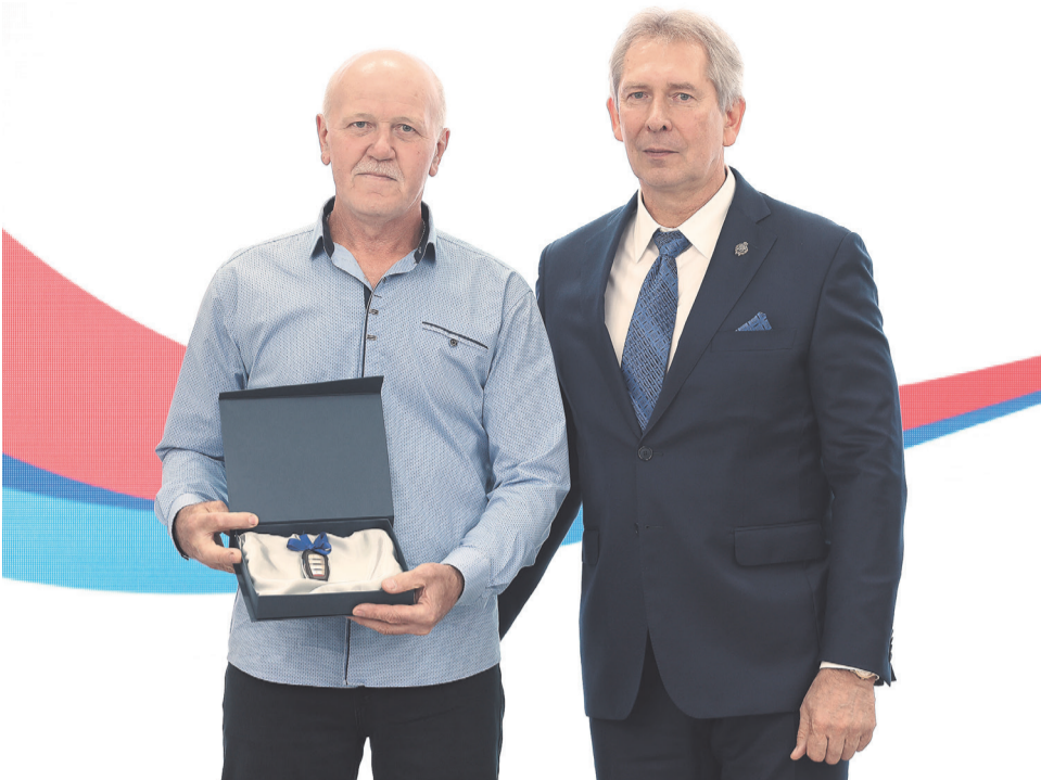
↑ Ключи от автомобилей Haval вручили 11-ти металлургам.