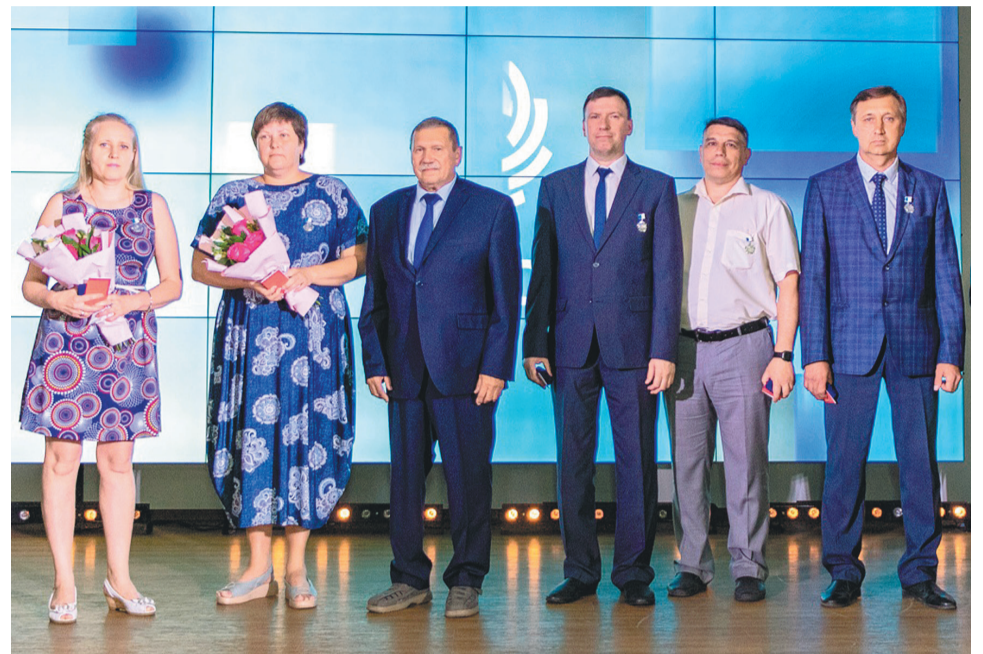
↑ Лучшим сотрудникам предприятия и ветеранам ПАО «Кокс» вручено более 300 наград.

В числе других наград коксохимиков — Почетные грамоты и благодарственные письма Министерства промышленности и торговли РФ, Парламента Кузбасса, администрации города, серебряный и бронзо-