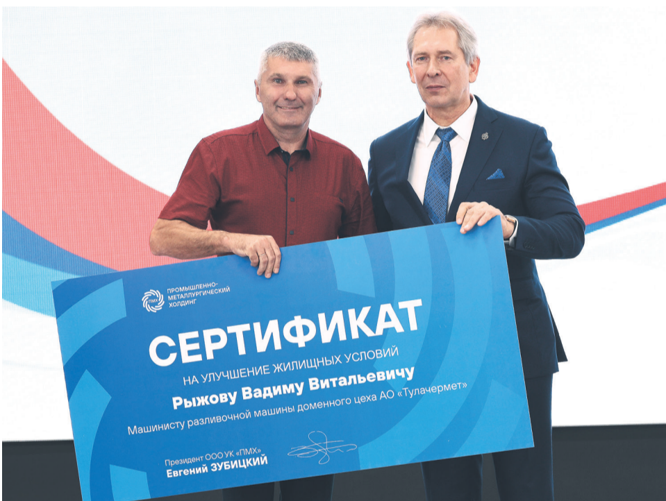
↑ Сертификаты на улучшение жилищных условий получили 6 работников.