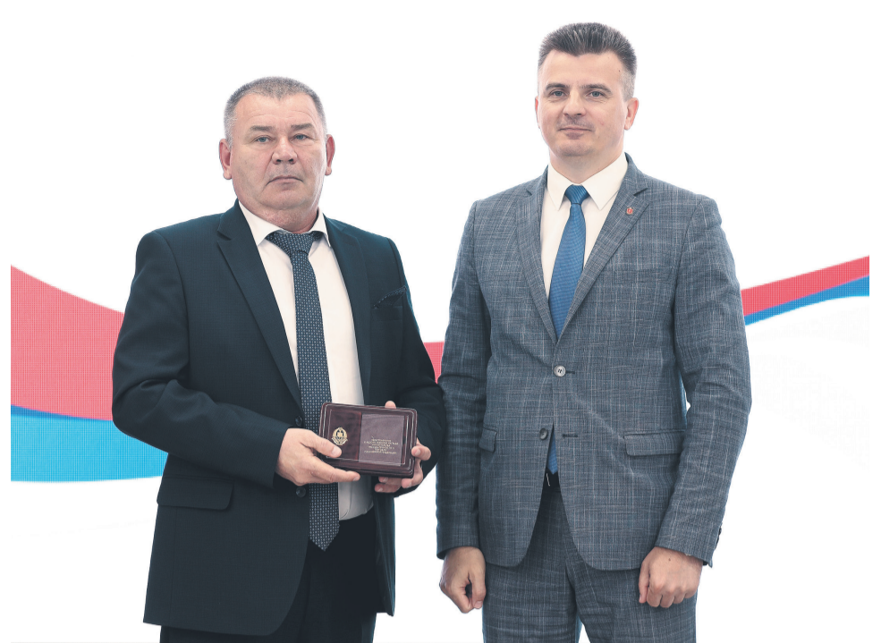
↑ Министр промышленности и торговли Тульской области Вячеслав Романов поздравил металлургов.