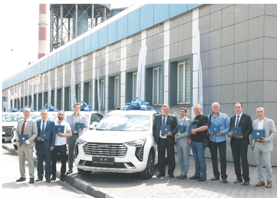
↑ Металлурги со своими новыми автомобилями.

Более 250 сотрудников были награждены ко Дню металлурга. Железных сил, стальных нервов и горячего сердца — именно такие пожелания звучали в честь металлургов в преддверии профессионального праздника