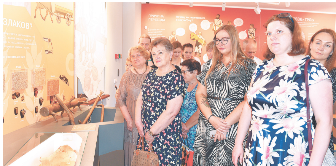
← На выставке представлено более 200 подлинных экспонатов.