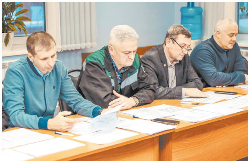
В комиссию вошли руководители подразделений.