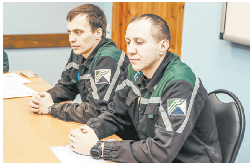
Резервисты – люди, которые в будущем могут стать управленцами.