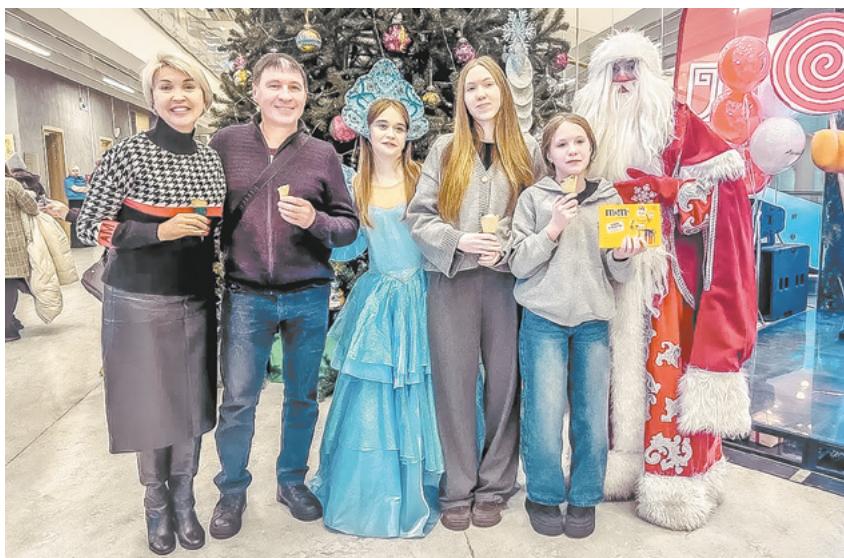
Новогодний спектакль порадовал взрослых и детей.

Н асладиться сказочной постановкой смогли и родители – всего коксохимикам и их детям раздали 466 билетов. Представление по мотивам сказки Льюиса Кэрролла прошло в учеб-