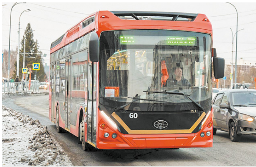
Маршрут троллейбуса № 1А кемеровчане посчитали удобным.

которые пользовались маршрутом № 1А, положительно оценили новую схему движения и выразили готовность пользоваться им чаще при увеличении количества рейсов.