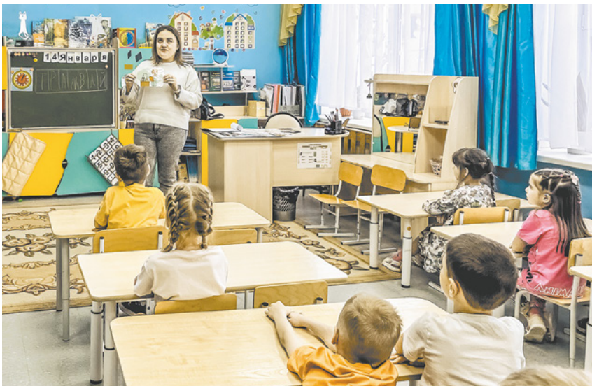
Ребятишки из детского сада № 21 знают всё о нашем предприятии.