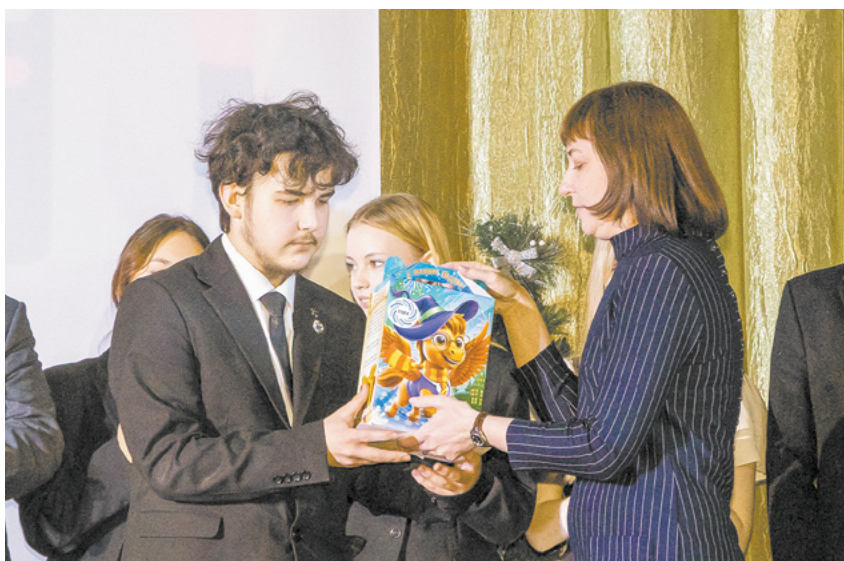
За успехи в олимпиаде – именная стипендия и сладкий подарок.

дагогам: вы не просто готовите детей, вы вкладываете в них свои силы, знания и душу, формируя тем самым наше общее будущее. Мы, в свою очередь, продолжим развивать программы профориентации, помогать школьникам в выборе профессии и поддерживать их на пути к успеху.