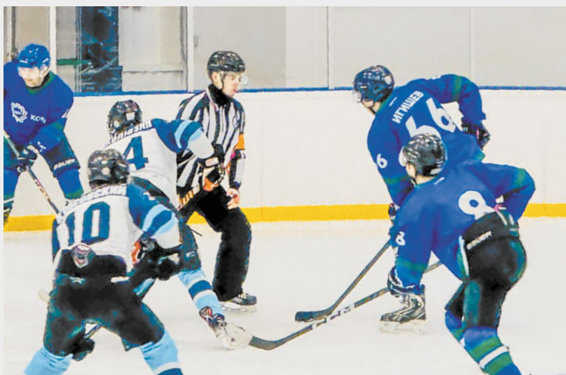
Со счётом 5:3 завершилась встреча хоккейных команд «Кокс» и «Сибирская вагонная компания» в рамках регионального этапа Лиги Надежды. Команда коксохимиков продемонстрировала высокий уровень мастерства и самоотдачу.