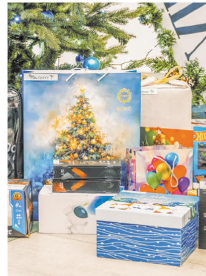
Подарки малышам от коксохимиков.

– Ребята, вы знаете, что Новый год – это самый волшебный праздник. Поэтому мы желаем вам искренне верить в чудо, и оно непременно случится, – обратился к малышам Дед Мороз .