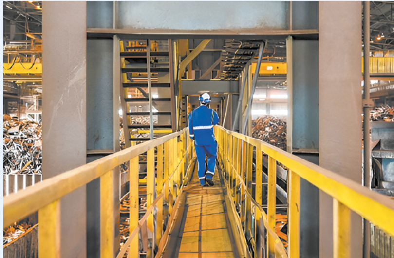
Существенно сократили время разгрузки лома.

ПМХ-Инфотех разработал программу электронной очереди для ускорения разгрузки лома.