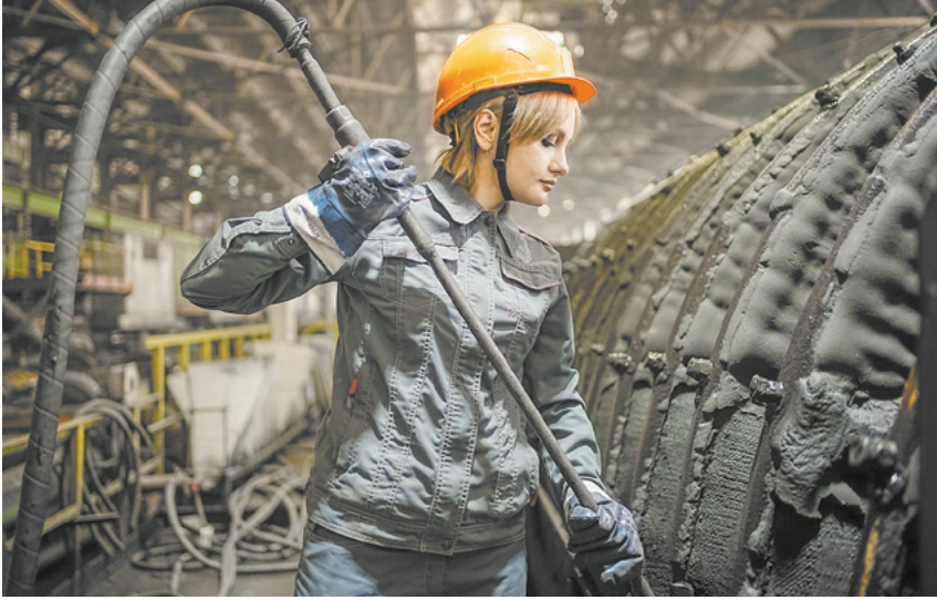
Нарастили производственную мощность.