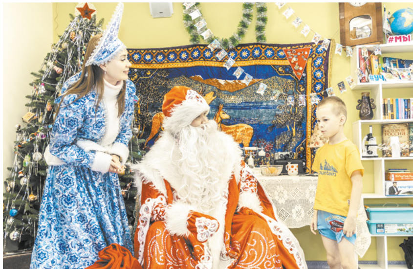
Добрая традиция радовать детей сохраняется уже несколько лет.

кологическом отделении Кузбасской областной детской клинической больницы им. Ю.А. Атаманова.