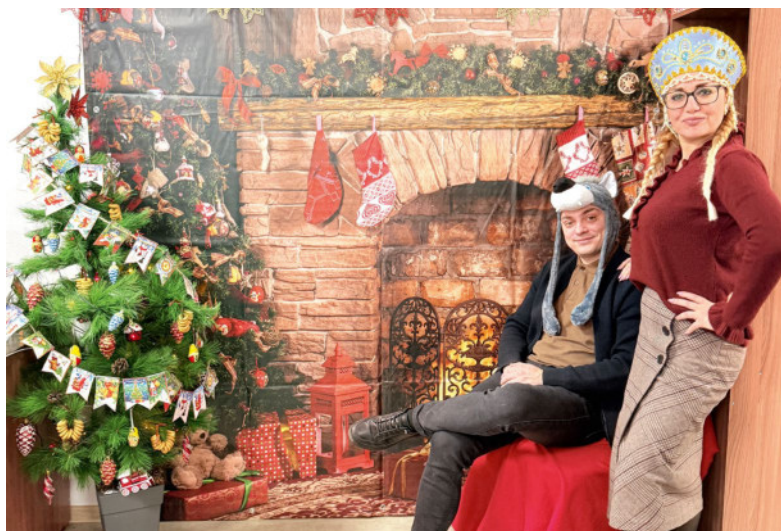
Сотрудникам отдела закупок оборудования и услуг под силу и создание новогодней сказки.