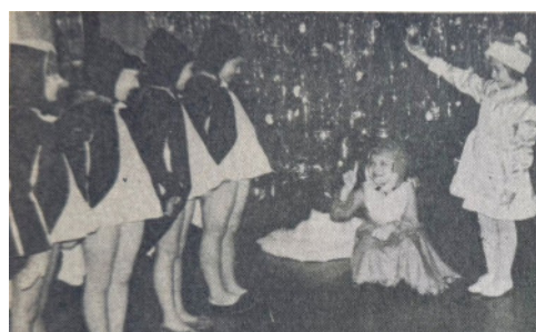
«Пингины» встречают Снегурочку с «лисичкой».

Одно из волнительных воспоминаний советской детворы – новогодние утренники, которые проходили во Дворце культуры горняков, «Спутнике» и Дворце пионеров. Чтобы дочки и сыночки предстали у елочки наряженными, мамы ночами шили костюмы из марли, ваты, мишуры.