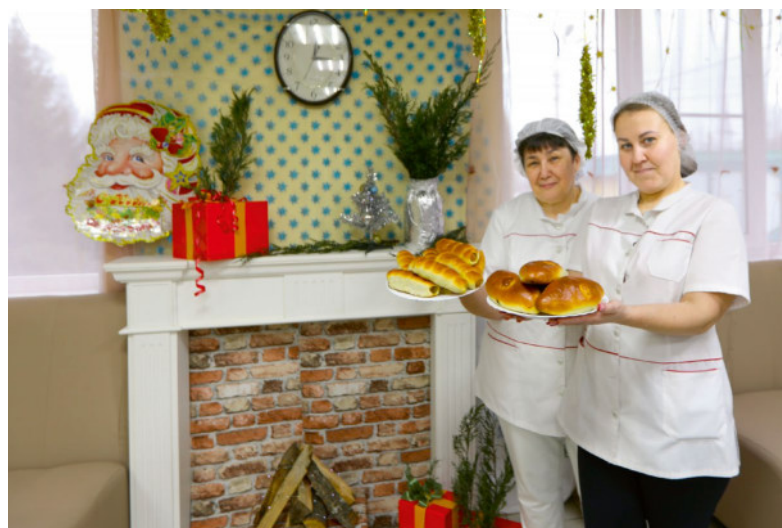
Конкурсную комиссию у камина желаний повара общепита встречали ароматной выпечкой.