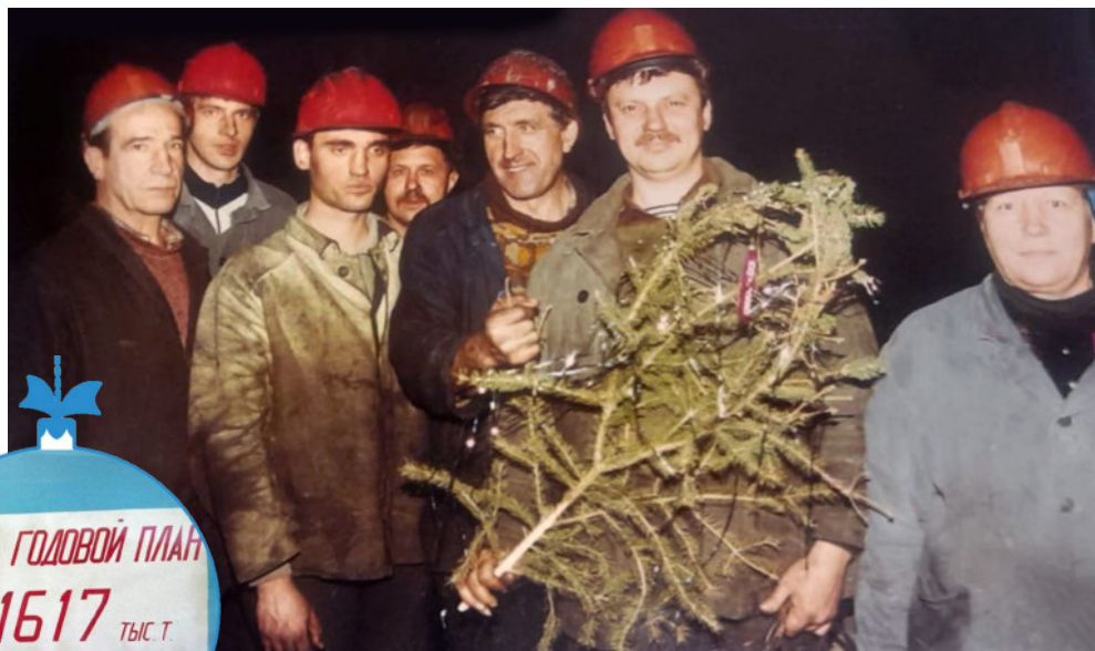
Коллектив обогатителей фабрики готовится к встрече Нового года.