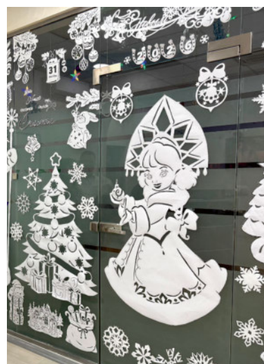
Ажурные узоры в ПТО как отдельный вид искусства.