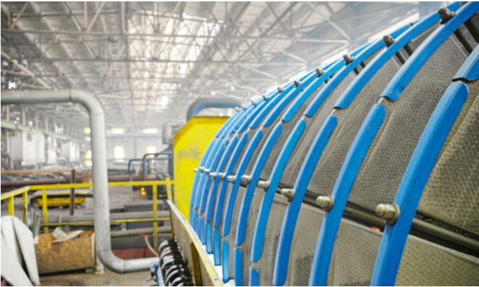
Новый фильтр включен в технологический процесс фабрики.