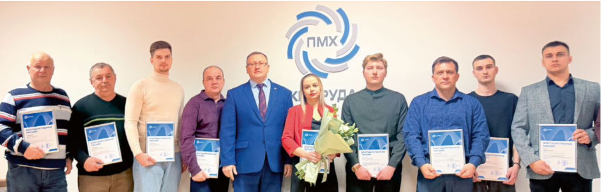
В профессиональный праздник энергетиков 32 работника предприятия отмечены благодарственными письмами и почетными грамотами управляющего директора, почетными грамотами профсоюзной организации.