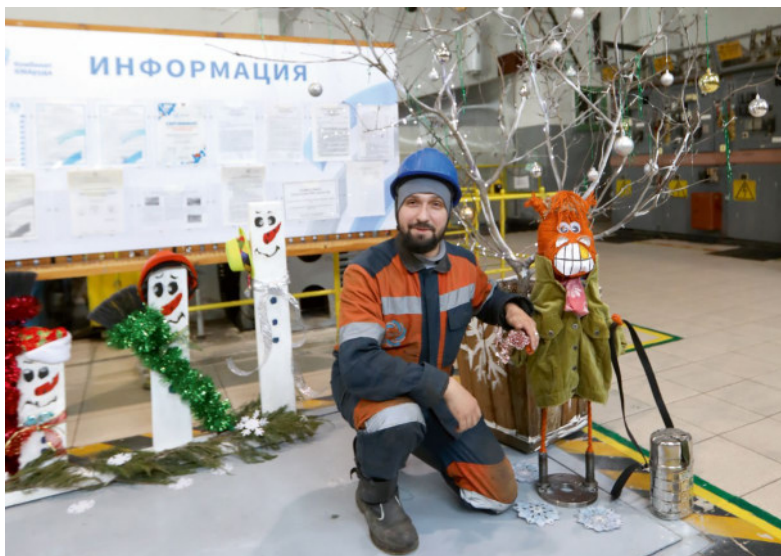
«Улыбайтесь!» – призывает символ года, созданный работниками участка № 7 шахты.