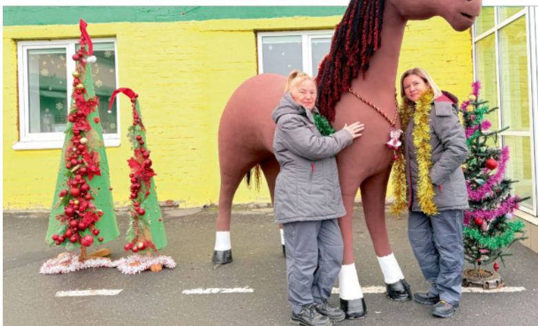
Богатырского коня к диспетчерской автоцеха доставили вшестером.