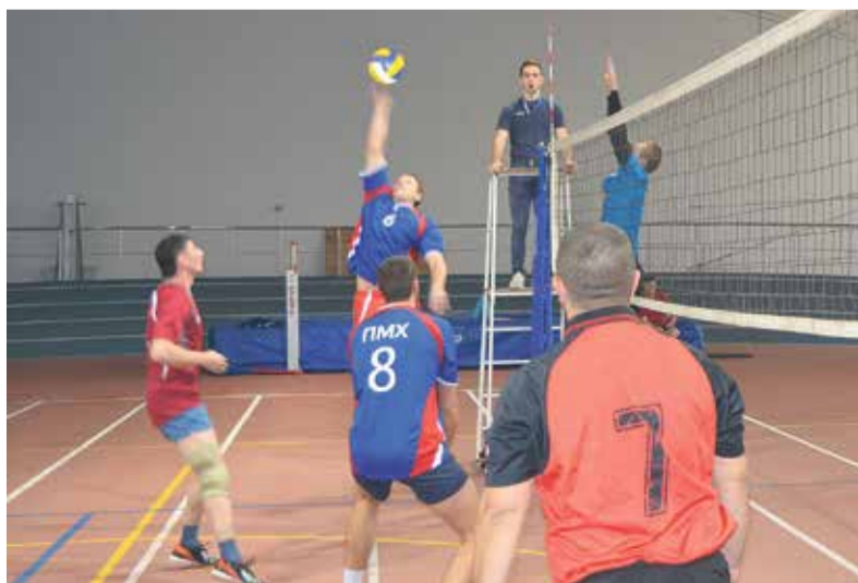
Играет сборная комбината