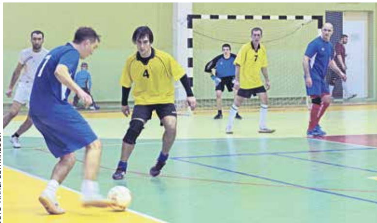
Борьба за мяч между футболистами РСЦ и цеха АТ и СМ

Затем на поле вышли команды горного и ремонтно-строительного цехов. Уже на пятой минуте строители забили первый гол, а спустя две минуты ещё один. При этом они грамотно выстраивали защиту, пробить которую никак не удавалось. И только на 14-й минуте футболисты горного цеха успешно прорвались к воротам соперника и забили гол. По-видимому, это вдохновило, и во втором тайме они стали проявлять большую активность, даже применили запрещённый приём, что, конечно, не осталось незамеченным. Судья назначил шестиметровый пенальти. Роман Теплов