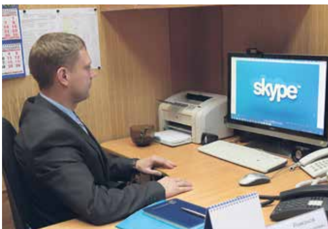
Все руководители имеют доступ к программе Skype

Селекторные совещания – неотъемлемая часть жизни любой организации. Они необходимы для контроля и координации деятельности, оперативного информирования. Долгие годы на нашем предприятии такие совещания реализовывались с помощью телефонной линии и специальных устройств – селекторов. С появлением современных средств связи рабочие совещания решено проводить с помощью компьютерных технологий. Остановились на программе Skype для бизнеса. Всех участников совещания снабдили камерами и колонками, провели ознакомительный инструктаж. Дни и часы проведения оставили прежними. Зато изменился формат – теперь руководители не только слышат друг друга, но и видят. Расширился и список участников. Если раньше в него входили в основном производственники, то теперь добавились сотрудники социального и финансового блоков, причём на правах не только слушателей, но полноправных собеседников.