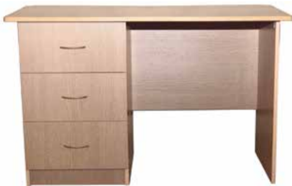
Стол, изготовленный в новом цехе