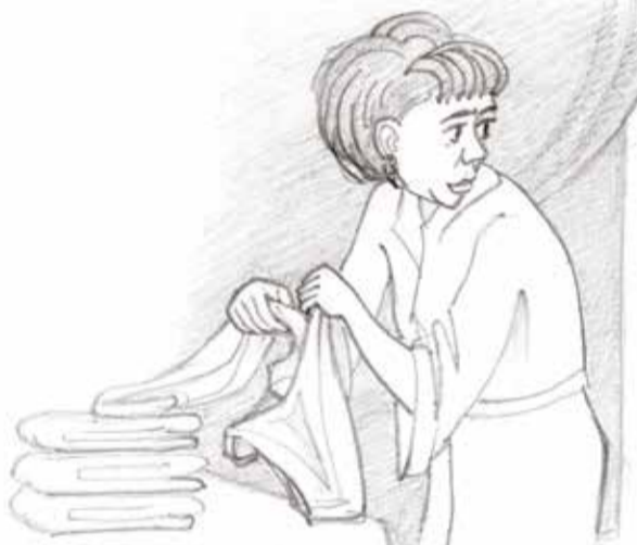
РИСУНОК И СТИХ НИКОЛАЯ ДВЯНИНА