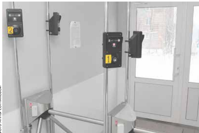
Индикаторы на КПП участка № 2 фабрики

В среднем за сутки на шахте на алкотестерах проверяют 2561 человека, на фабрике – 801. В 2016 году выявлено 140 случаев прихода на комбинат в неадекватном состоянии, в 2017-м – 131. Соответствующее СМС-сообщение сразу поступает на сотовый телефон непосредственного руководителя. Окончательные выводы делаются после медицинского заключения. Работникам с незначительным опьянением объявляют замечания и выговоры, кроме того, их лишают