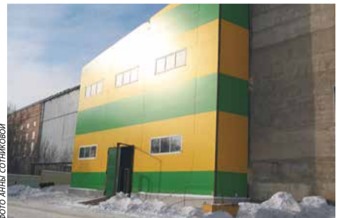
Новый цех металлоконструкций

Строительная часть практически закончена. Сейчас идёт прокладка отопления. Строители изготовили железобетонную цокольную стену и на следующем этапе займутся заливкой чистовых полов и фундаментов под новое оборудование. Ремонтники понемногу уже обустроивают помещение. В здании установлен мостовой двухбалочный кран грузоподъемностью 10 тонн. Он оборудован блоком приёма