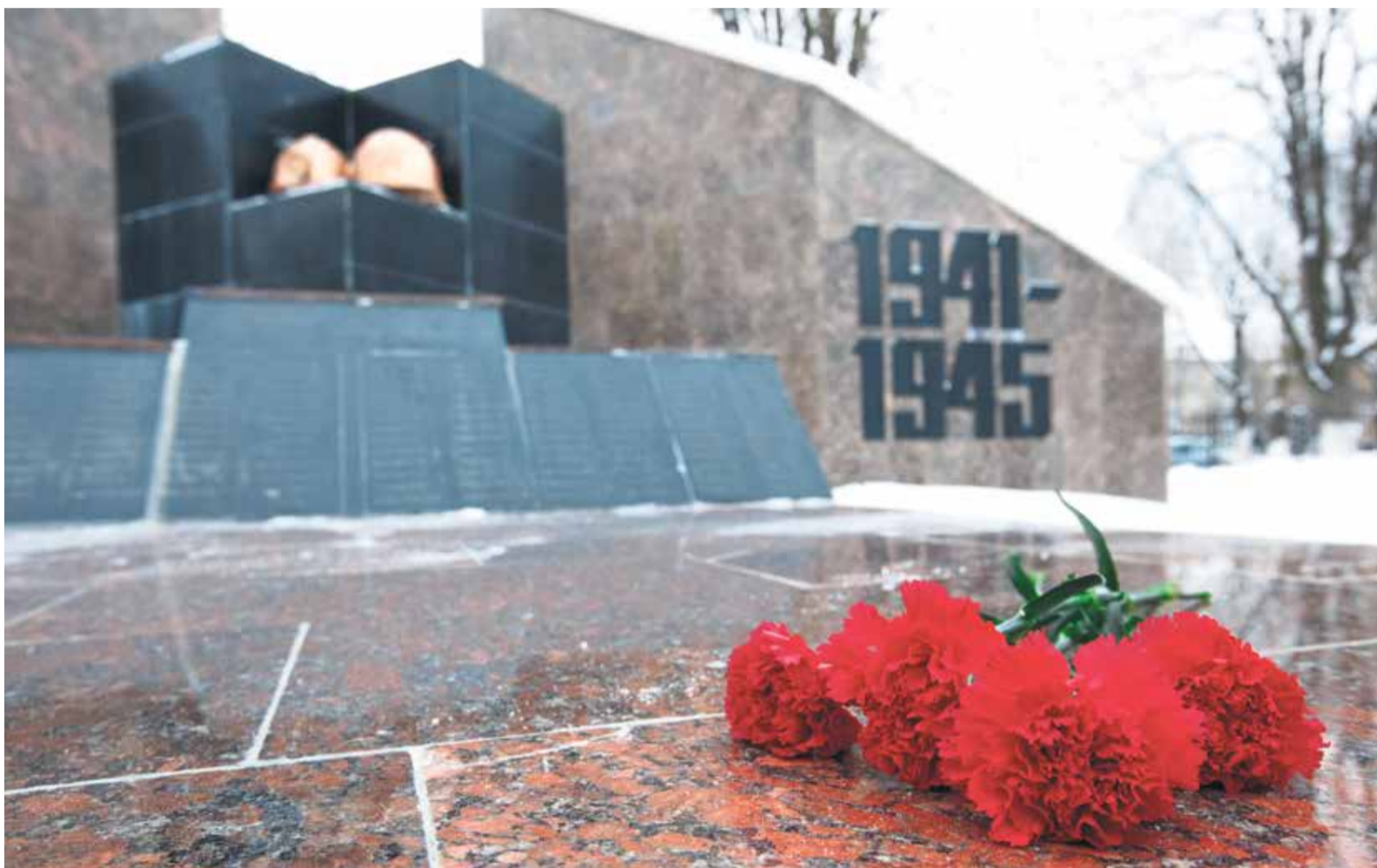
Памятник кмастроевцам, не вернувшимся с войны