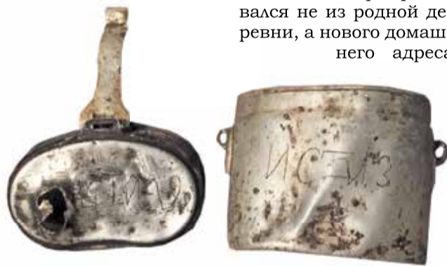
Найденный котелок с надписями

Поисковыми работами занимались в Белгородской, Воронежской, Брянской, Смоленской, Калужской областях. Для губкинцев организовали больше 70 экскурсий в музей клуба.