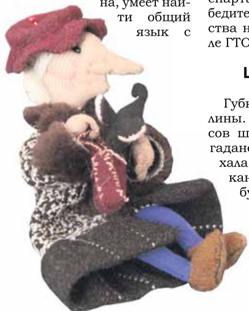
Кукла старуха Шапокляк, выполненная в чулочной технике