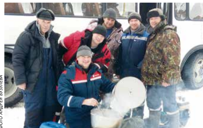
Рыбаки в предвкушении ухи

На Белгородском водохранилище прошло посвящённое закрытию сезона первенство по зимней рыбалке среди работников Комбината КМАруда.