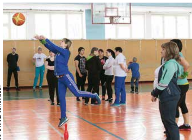
Бросок баскетбольного мяча