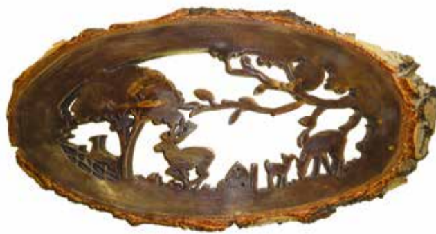
Олени у деревьев

он получил от отца ещё мальчишкой и мастерил дома лавочки, утварь, например, разделочные доски для мамы. А пару лет назад увидел обучающее видео в интернете, стало интересно. Купил лобзиковый станок. Холстами для Тютрина становятся листы сосновой или берёзовой фанеры. Прекрасно подходят и спилы целого ствола: кромка с корой придаёт вырезанным картинам неповторимый стиль. Технология изготовления выглядит так: в заготовке делается отверстие, в него вставляется полотно лобзика и начинается пропиливание по намеченной контуре, а уже на завершающем этапе в ход идут надфили, стамески и наждак. Поми-