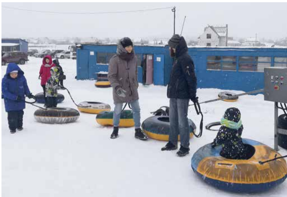
Тюбинги полюбились детям