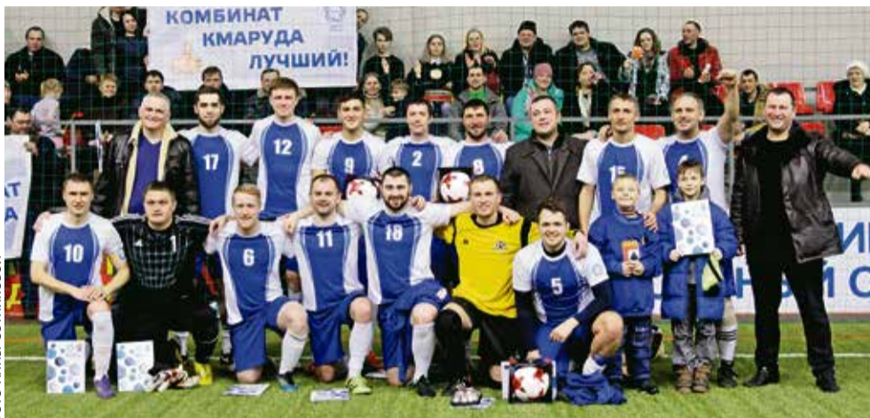
Фотография на память после матча

По его словам, один из главных ключей к успеху футболистов – большой опыт каждого игрока. Этот опыт ребята продемонстрировали в финальной игре турнира. Её первый тайм шёл в напряжённой борьбе. Долгое время открыт счёт не удавалось, но ближе