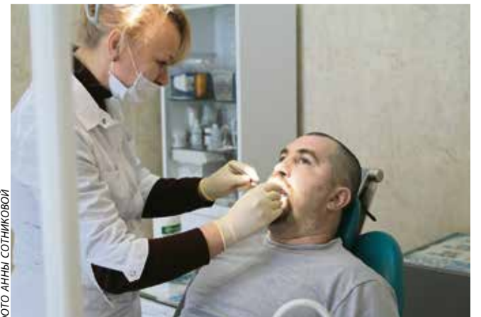
На приёме у стоматолога