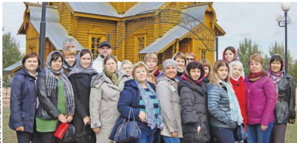
Группа комбинатовцев у храма священномученика Игнатия Богоносца

Проезжая по улицам города, обратили внимание, что сохранилось много старинных зданий. Даже пресловутый ликёро-водочный завод и тот, оказывается, – старейшее предприятие страны (основан в 1887 году). Но самым древним строением считается храм святителя Николая Чудотворца, открытый в 1840 году. Ему удалось избежать разрушений благодаря тому, что его использо-