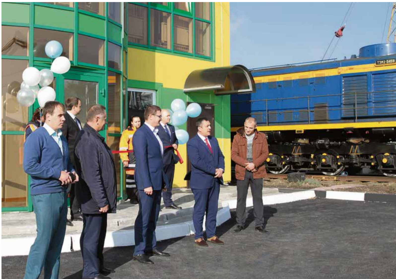
Открытие АБК железнодорожного цеха прошло в торжественной обстановке

В железнодорожном цехе 18 октября в торжественной обстановке открылся новый административно-бытовой корпус, ставший первым объектом комплекса новой шахты.