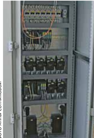
Вычислительный центр СЦБ

сегодняшний день завершён первый из них. Новые технологии внедрены в маневровом районе Кварцитная. Здесь оборудовано автоматизированное рабочее место диспетчера, релейная, установлены напольные устройства, включающие в себя датчики счёта осей. Работе