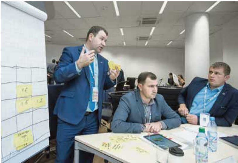
Работа в группах