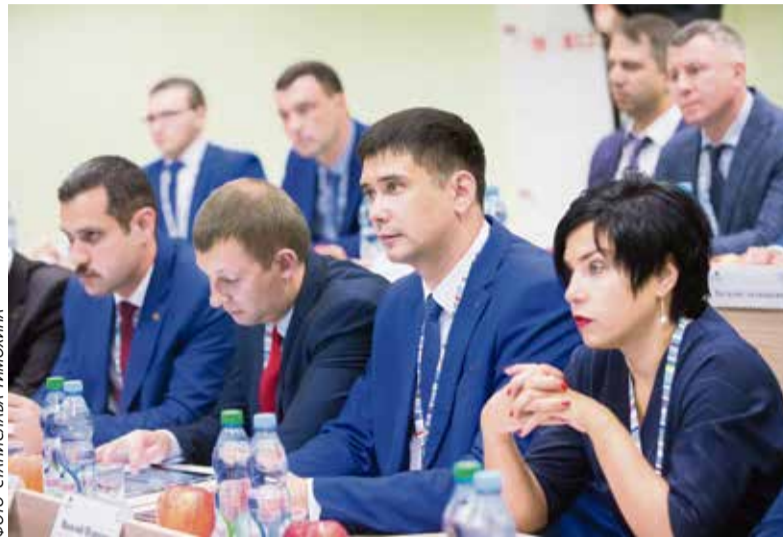
Во время лекции