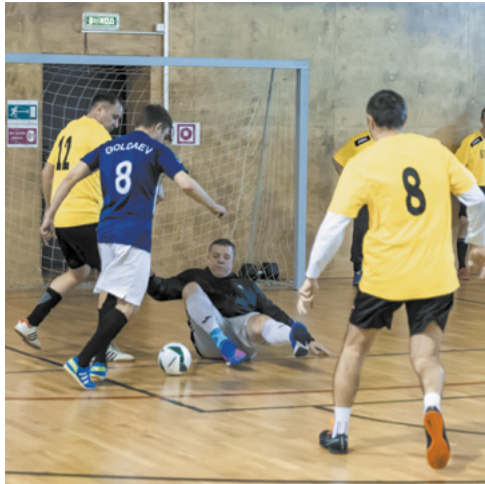
Зрелищные моменты игры.