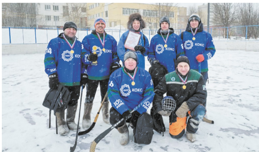
«Горячий лёд» стал для наших спортсменов победным.