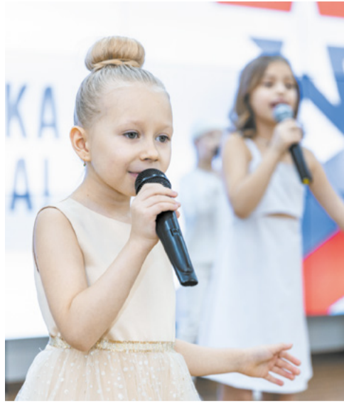
Поздравления от юных талантов.

– Для нашего предприятия этот праздник всегда имел огромное значение, ведь коксохимикам не раз приходилось вставать на защиту Родины. Самая важная битва – это, конечно, Великая Отечественная война, когда более двух тысяч заводчан ушли на фронт, многие из них не вернулись с полей сражений. В настоящее время на предприятии трудятся порядка 85 работников, которые в разное время защищали страну в Афганистане, Чечне и других горячих точках. Сегодня 36 коксохимиков и работников «Кокс-Охрана» несут боевую вахту, находясь в