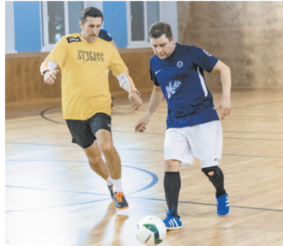
Соперники борются за матч.