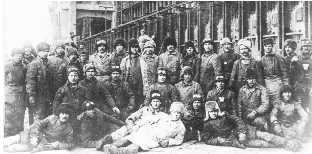
2 марта 1924 года. Бригада, выдавшая первый кокс.

– Находясь в черте города, ПАО «Кокс» осознаёт ответственность перед жителями областного центра и предпринимает всё для снижения воздействия на окружающую среду и улучшения экологии. Обязательное требование к новым проектам, реализуемым на заводе, – экологическая безопасность. В июне 2021 года ПМХ и Правительство Кемеровской области – Кузбасса заключили соглашение по экологической модернизации предприятия. Документ подписали глава региона Сергей Евгеньевич Цивилев и Президент ПМХ Евгений Борисович