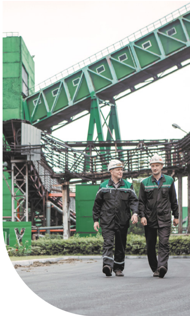
Промышленные пейзажи за век изменились до неузнаваемости.

– Важным экологическим проектом современности стал механизированный погрузочно-разгру-