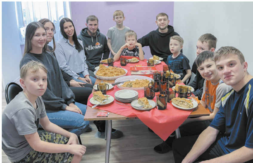
Традиционное чаепитие с маленькими друзьями.