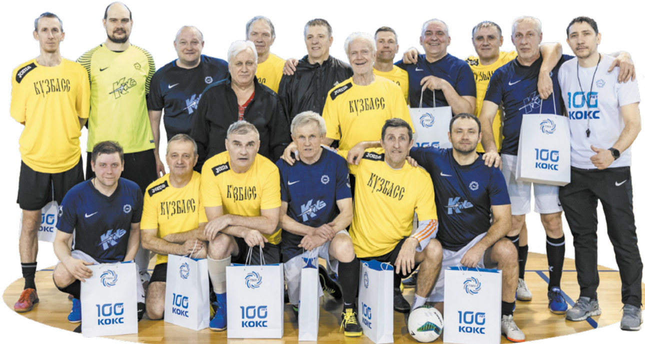
Ветераны футбола и коксохимики ежегодно собираются на товарищескую игру.

Многое сделал этот человек для развития собственной сырьевой базы «Кокса». Он был уверен, что свой уголь поможет заводу ликвидировать зависимость от сторонних добычных предприятий. Мечтал об этом. Как профессионал-коксо-