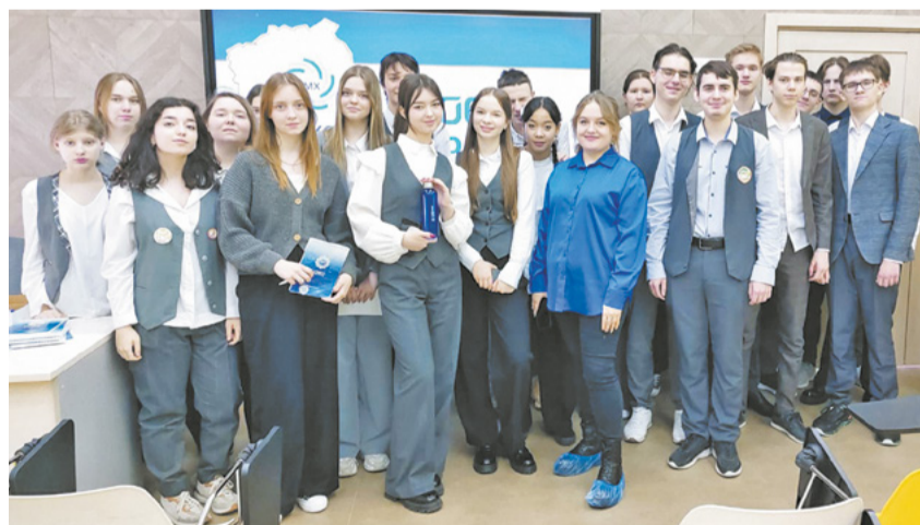
Сотни ребят уже познакомились с работой завода.