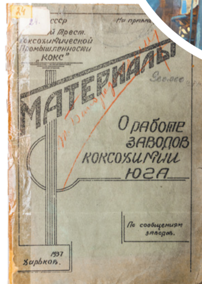
Экспонаты юбилейной выставки в музее ИЗО.

предприятия – это новый и очень интересный опыт для нашего музея. В рамках экскурсии мы выбрали безопасные локации