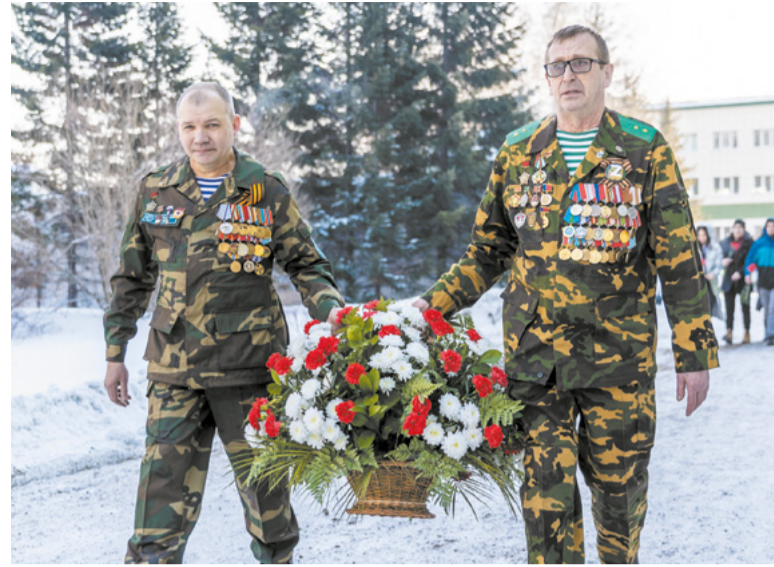
Традиционное возложение цветов к Мемориалу воинам-коксохимикам.