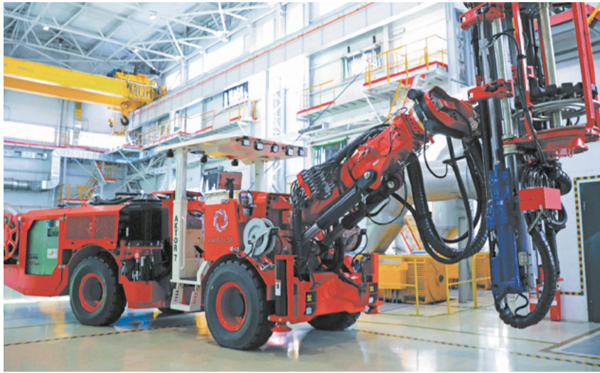
Новое шахтное оборудование поступило на комбинат «КМАруда».

Веерная технология позволяет обуривать камеры из одного статичного положения на 360 градусов. На НКР, чтобы изменить направление бурения, требуется демонтировать станок, перевезти и смонтировать его на новом месте. Показатели работы НКР зависят от бесперебойной подачи сжатого