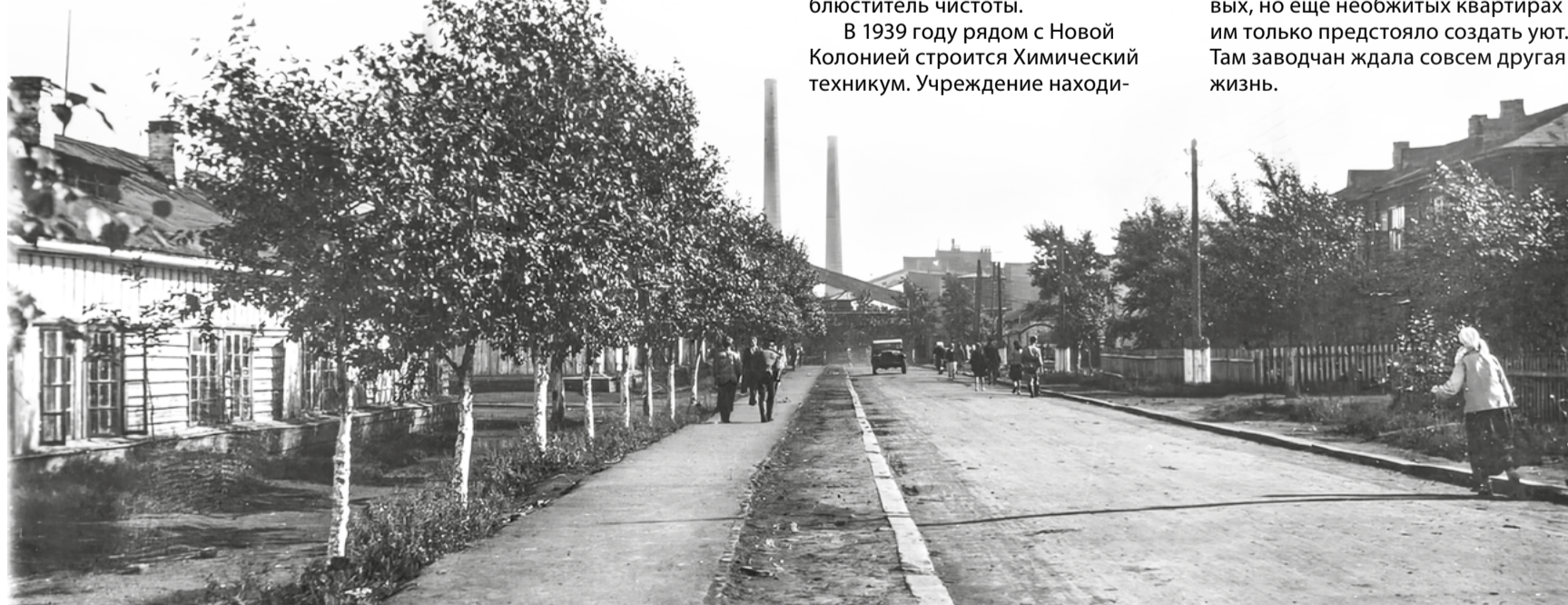
Вид на завод с Коксового переулка, Новая Колония, 1947 год.

В 60-е годы вслед за Нижней Колонией стали расселять жителей Новой Колонии. С тоской люди покидали милые сердцу дома и навек прощались с родным посёлком. Большинство семей переехало в многоквартирники и общежития, построенные коксохимиками. В новых, но ещё необжитых квартирах им только предстояло создать уют. Там заводчан ждала совсем другая жизнь.