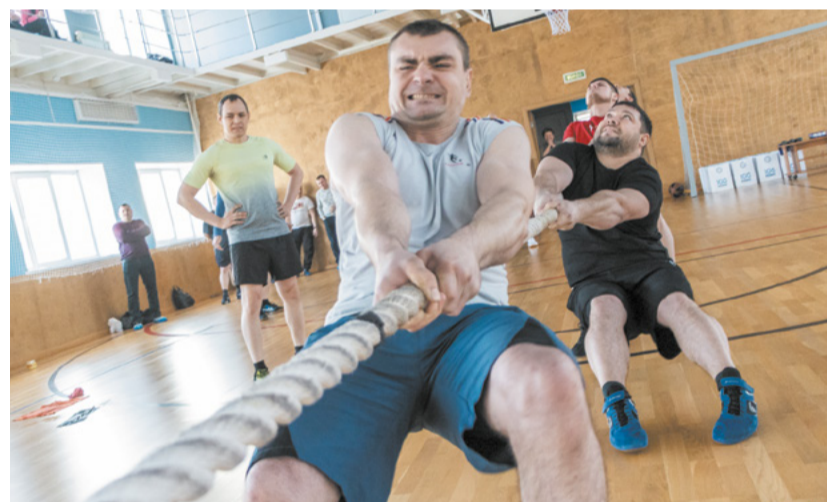
Канат – спорт для настоящих мужчин.